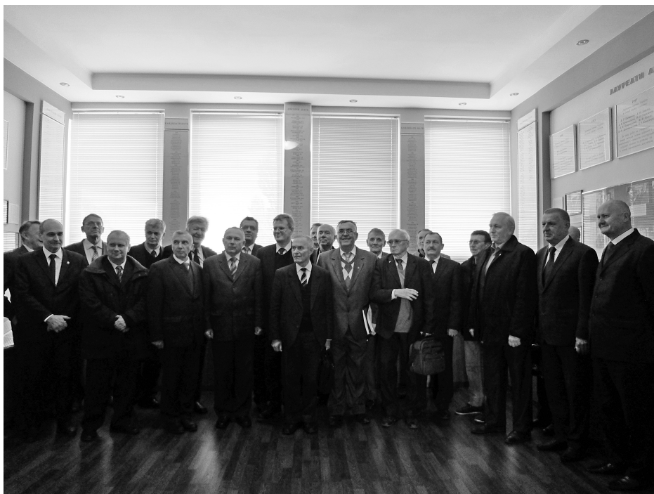
Фото на згадку – учасники урочистих зборів у меморіальному музеї засновника інституту академіка Г. С. Писаренка.

На адресу інституту надійшли також численні вітальні телеграми від установ і організацій-партнерів, а саме: Інституту геотехнічної механіки імені М. С. Полякова, Інституту ядерних досліджень НАН України, АТ “МОТОР СІЧ”, Центрального науково-дослідного інституту озброєння та військової техніки, Державного науково-випробувального центру Збройних сил України, Державного науково-дослідного інституту авіації, ДП “Державний науково-технічний центр з ядерної та радіаційної безпеки” та ін.