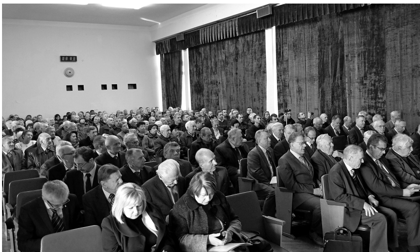
У конференц-залі інституту під час проведення урочистих зборів.

Участь у зборах взяли співробітники інституту, представники президії та наукових установ Національної академії наук України, вищих навчальних закладів і провідних підприємств ракетно-космічної, авіаційної, машинобудівної промисловості, а також уповноважені особи Київської міської і Печерської в м. Києві районної державних адміністрацій, ветерани і колишні працівники інституту.