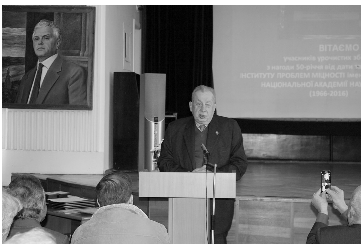
Виступ Почесного директора інституту академіка В. Т. Трошенка.

країні колектив інституту продовжує наполегливо працювати над створенням нових і удосконаленням існуючих методів досліджень механічної поведінки конструкційних матеріалів, процесів їх пошкодження й руйнування та бере активну участь у вирішенні актуальних питань, пов'язаних зі зміцненням обороноздатності і безпеки держави.