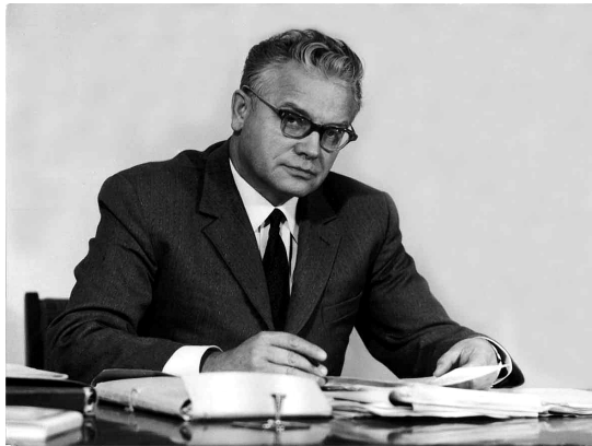
Засновник інституту академік НАН України Георгій Степанович Писаренко.

25 жовтня 2016 року відбулися урочисті збори трудового колективу Інституту проблем міцності імені Г. С. Писаренка НАН України з нагоди 50-річчя від дня його заснування (жовтень 1966 р.). Організатором і першим директором цієї наукової установи був академік Георгій Степанович Писаренко (1910–2001), ім'я якого присвоєно інституту в 2002 р.