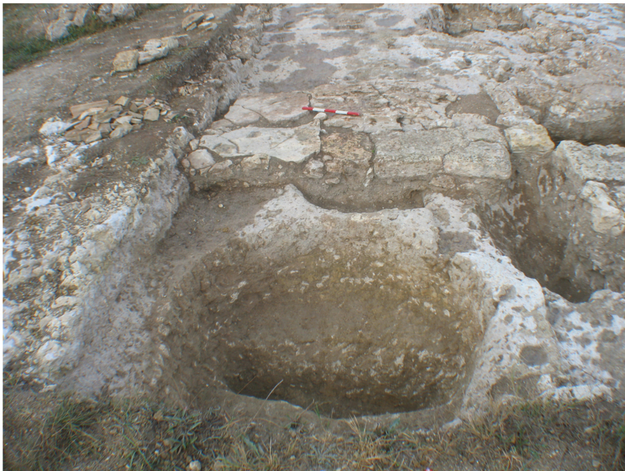
Рис. 2. Яма-суплоприемник.