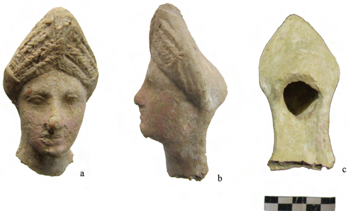
Рис. 3. Фрагмент терракоты: а — вид спереди, б — вид сбоку, с — вид сзади.