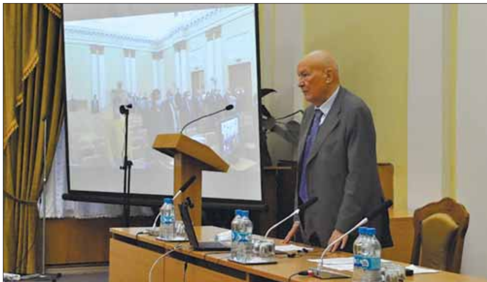
Відкриття виборчої сесії Загальних зборів НАН України. Головуючий — в.о. президента НАН України академік НАН України В.П. Горбулін

НАН України»; від 07.09.2020 № 139 «Про дату та програму проведення виборчої сесії Загальних зборів НАН України та загальних зборів відділень НАН України»; розпорядження Президії НАН України від 15.09.2020 № 391 «Про затвердження розташування виборчих дільниць та складу дільничних виборчих комісій з проведення виборів президента НАН України та Президії НАН України»), яке відповідає всім вимогам чинного законодавства (частини 11 і 12 ст. 17 Закону України «Про наукову і науково-технічну діяльність»), нормативним документам Академії (пп. 4.1–4.5 і 7.3–7.8 Статуту Національної академії наук України; пп. 5–8 і 10–13 Положення про відділення НАН України) та враховувало вимоги карантинного режиму (постанова Кабінету Міністрів України від 22.07.2020 № 641 «Про встановлення карантину та запровадження посилих протиепідемічних заходів на території із значним поширенням гострої респіраторної хвороби COVID-19, спричиненої коронавірусом SARS-CoV-2»).