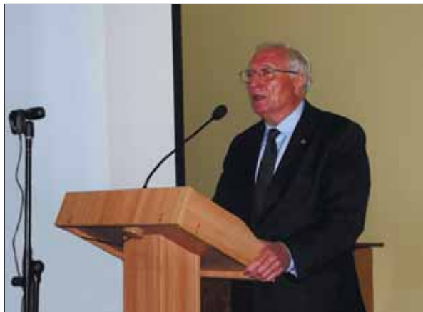
Виступ кандидата в президенти НАН України академіка Сергія Васильовича Комісаренка