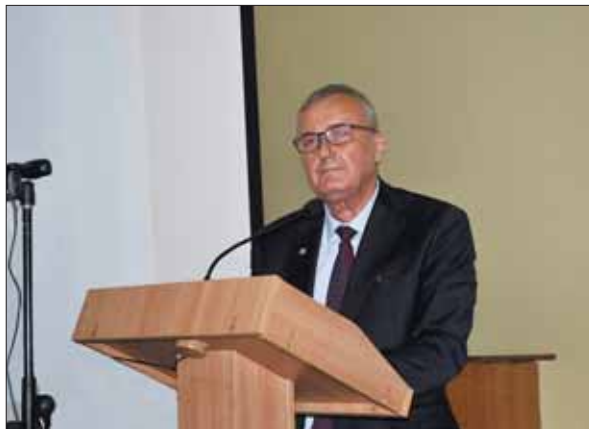
Виступ кандидата в президенти НАН України академіка Анатолія Глібовича Загороднього

Виборча дільниця № 12. Відділення економіки НАН України. Місцезнаходження — Національна бібліотека України ім. В.І. Вернадського (другий поверх). Голова дільничної виборчої комісії — академік НАН України О.І. Амо-