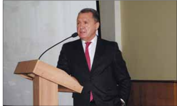
Виступ кандидата в президенти НАН України академіка Володимира Петровича Семиноженка

На другий день сесії Загальних зборів НАН України, 8 жовтня 2020 р., засідання відбулися у традиційному режимі по відділеннях НАН