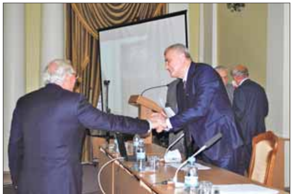
Академік С.В. Комісаренко вітає новообраного президента Національної академії наук України академіка Анатолія Глібовича Загороднього