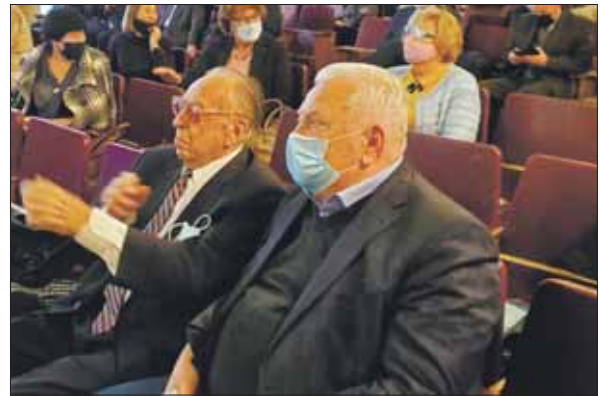
На виборчій дільниці № 10 (Відділення біохімії, фізіології і молекулярної біології НАН України). До виступу готується член-кореспондент НАН України Ісаак Михайлович Трахтенберг