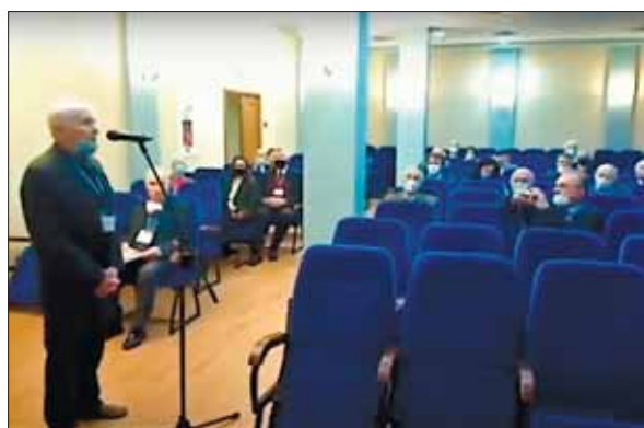
Виступ академіка НАН України Віталія Івановича Старостенка на виборчій дільниці № 5 (Відділення наук про Землю НАН України)