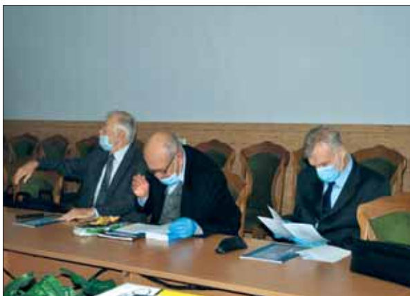
На виборчій дільниці № 9 (Відділення хімії НАН України)