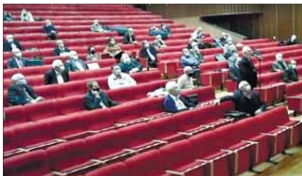
На зв'язку виборча дільниця № 4 (Відділення фізики і астрономії НАН України). Запитання академіка НАН України Вадима Михайловича Локтева