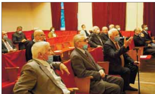
На виборчій дільниці № 1 (Відділення математики НАН України)