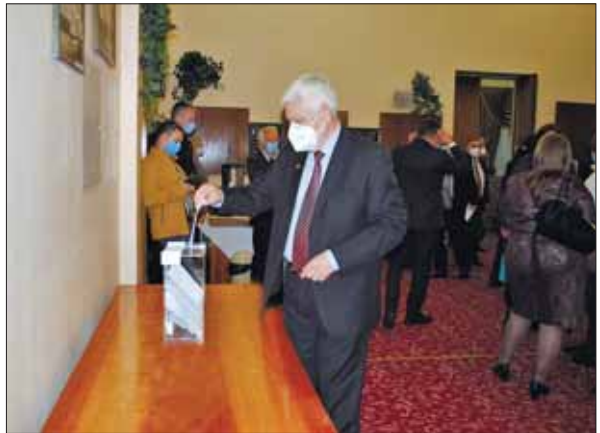
Голосування на виборчій дільниці № 15