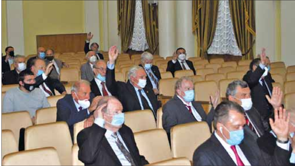
Відкрите голосування на виборчій дільниці № 15 за порядок денний сесії Загальних зборів

їни (Інститут математики; Інститут фізики; Інститут металофізики ім. Г.В. Курдюмова; Інститут фізики напівпровідників ім. В.Є. Лашкарова; Інститут теоретичної фізики ім. М.М. Боголюбова; Інститут електронної фізики; Радіоастрономічний інститут; Інститут радіофізики та електроніки ім. О.Я. Усикова; Інститут геотехнічної механіки ім. М.С. Полякова; Інститут геології і геохімії горючих копалин; Інститут ядерних досліджень; Інститут електрофізики і радіаційних технологій; Інститут прикладної оптики); академіками НАН України (В.І. Лялько, М.І. Павлюк, О.М. Пономаренко, Л.Г. Руденко, В.І. Старостенко, В.М. Шестопапов); членами-кореспондентами НАН України (В.О. Ємельянов, С.Б. Шехунова);