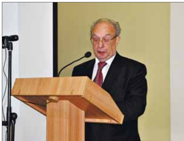
Виступ кандидата в президенти НАН України академіка Владислава Володимировича Гончарука