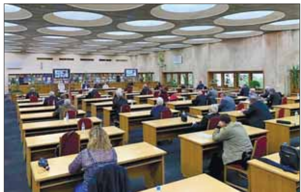
Виборча дільниця № 13 (Відділення історії, філософії та права НАН України)