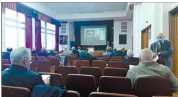
На виборчій дільниці № 3 (Відділення механіки НАН України)