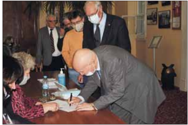
Учасники виборчої сесії Загальних зборів НАН України отримують бюлетені для голосування

Засідання було присвячено обранню шляхом таємного голосування першого віцепрези-