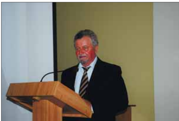
Виступ президента Національної академії медичних наук України академіка НАМН України Віталія Івановича Цимбалюка

України і були присвячені обранню академіків-секретарів відділень.