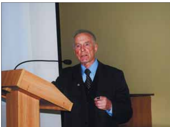
Виступ академіка НАН України Антона Григоровича Наумовця