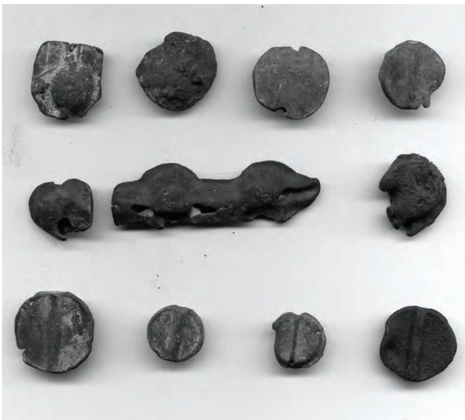
Рис. 1. Типы заготовок для оттисков печатей в комплексе печатей херсонского архива