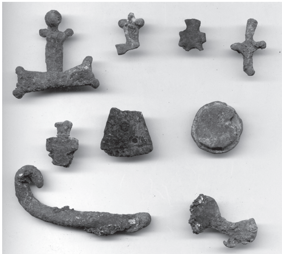
Рис. 2. Предметы из свинца (пряжки, крестики, амулеты и т.п.) из сопутствующего материала в комплексе печатей херсонского архива