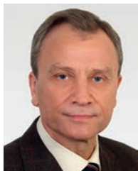
З інтерв'ю академіка-секретаря Відділення механіки НАН Украї- ни академіка НАН України Анато- лія Федоровича Булата

У становленні України як держави — визначного у світі виробника наукомісткої продукції, зокрема авіаційної та космічної техніки, є великий внесок Бориса Євгеновича — людини-легенди, керівника, вченого, творця, чие життя до останнього подиху було присвячене науці та людству.