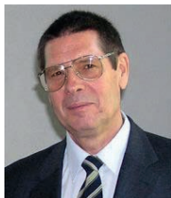
З інтерв'ю віцепрезидента Національної академії наук України, голови Секції хімічних і біологічних наук НАН України академіка НАН України Вячеслава Григоровича Кошечка

Відхід з життя Бориса Євгеновича — величезна втрата для світової і вітчизняної науки, особливо це непоправна втрата для Національної академії наук України та багатьох із нас.