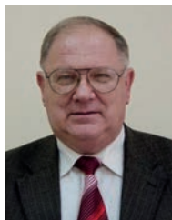
З інтерв'ю академіка-секретаря Відділення хімії НАН України академіка НАН України Миколи Тимофійовича Картеля

Світла пам'ять про нього збережеться в серцях всіх, хто його знав.