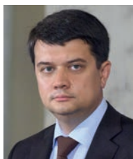
З виступу Голови Верховної Ради України Дмитра Олександровича Разумкова

Борис Євгенович став легендою України. Людина, масштаб якої важко описати. Металург, інженер, винахідник, науковець, викладач. Перший нагороджений званням Героя України. Академік. Геній. Є багато слів, якими можна описати Бориса Євгеновича Патона, однак немає таких слів, які повною мірою могли б розкрити масштаб його постаті і масштаб тієї втрати, якої сьогодні зазнала наша країна. Я щиро дякую долі за те, що в житті мені випала можливість особисто поспілкуватися з Борисом Євгеновичем. Це була грандіозна особистість.