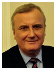
З інтерв'ю віцепрезидента Національної академії наук України академіка НАН України Анатолія Глібовича Загороднього

проблем. Поєднання цих якостей з великою вимогливістю дозволило йому згуртувати наш дружний колектив. Ми всі з великою радістю і натхненням працювали під його керівництвом. Це була унікальна людина, унікальний учений і унікальний керівник. Нам буде дуже не вистачати його. Однак ми докладатимемо всіх зусиль, щоб гідно продовжити справу всього його життя.