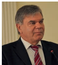
З виступу президента Національної академії педагогічних наук України академіка НАН України і НАПН України Василя Григоровича Кременя

Звісно, це величезна втрата для учнів, колег, це, безумовно, величезна втрата для родини, але це також величезна втрата для всієї України і всього світу. Крокуючи життям, Борис Євгенович давав нам всім надію на те, що наука переможе, на те, що саме через тісну взаємодію науки і освіти можливий розвиток держави, велич України. І найголовніший наш обов'язок сьогодні — це пам'ять про цього великого вченого.