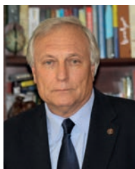
З інтерв'ю академіка-секретаря Відділення біохімії, фізіології і молекулярної біології НАН України академіка НАН України Сергія Васильовича Комісаренка

Співробітники Інституту хімії поверхні ім. О.О. Чуйка й досі пам'ятають виступ Бориса Євгеновича в 2011 р. на урочистостях з нагоди 25-річчя установи та відкриття меморіальної дошки її засновнику, який надихнув їх на нові звершення в роботі. Всі ми назавжди збережемо у своїх серцях світлу пам'ять про Бориса Євгеновича.