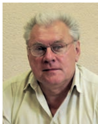
З інтерв'ю академіка-секретаря Відділення ядерної фізики та енергетики НАН України академіка НАН України Миколи Федоровича Шульги

Геній, легенда, людина з високими ідеалами в науці і житті, яскравий приклад служіння народові України. Перед нами стоїть завдання гідно продовжити справу Бориса Євгеновича.