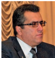
З інтерв'ю головного вченого секретаря Національної академії наук України академіка НАН України Вячеслава Леонідовича Богданова

завжди був для мене яскравим взірцем ставлення до улюбленої праці, відповідальності за доручену справу. І наш обов'язок зберегти і творчо примножити великий спадок великої Людини — Національну академію наук України.