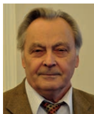
З інтерв'ю академіка-секретаря Відділення інформатики НАН України академіка НАН України Пилипа Іларіоновича Андона

Світла пам'ять про Бориса Євгеновича навіть залишиться у наших серцях.