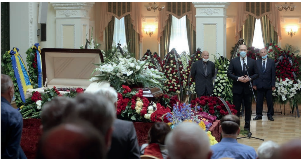
Промова прем'єр-міністра України Дениса Шмигала