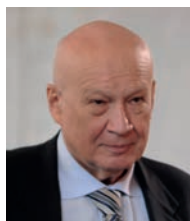
З виступу першого віцепрезидента Національної академії наук України академіка НАН України Володимира Павловича Горбуліна

Ми проводжаємо у вічність Героя України легендарного вченого Бориса Євгеновича Патона. А з ним і цілу епоху. Це велика втрата для України. Борис Євгенович був великою людиною. Людиною з великої літери. Понад пів століття він очолював Національну академію наук. Пам'ять про нього залишається жити у численних працях, публікаціях, винаходах та серцях багатьох поколінь. Він був реальним прикладом того, як потрібно своє життя віддавати служінню людям, улюбленій праці, науці, Україні. Дякуємо йому за це.