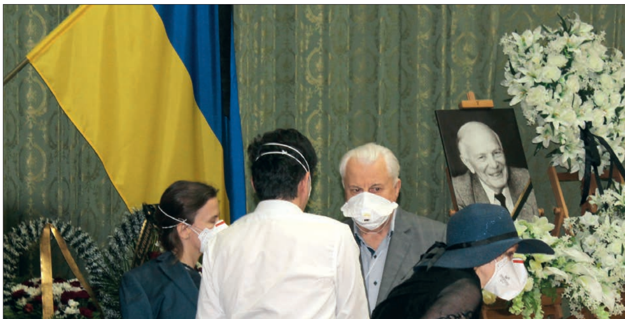
Президент України (1991–1994) Леонід Кравчук висловлює співчуття родині Бориса Євгеновича