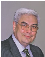
З інтерв'ю віцепрезидента Національної академії наук України, голови Секції суспільних і гуманітарних наук НАН України академіка НАН України Сергія Івановича Пирожкова

На жаль, як це не сумно, Бориса Євгеновича Патона не стало. Нехай земля йому буде пухом, а пам'ять про нього завжди житиме в наших серцях. Найкращим вшануванням пам'яті дорогого Бориса Євгеновича стане дбайливе ставлення до тих основ, які заклав він та його попередники, збереження та примноження надбань Академії.