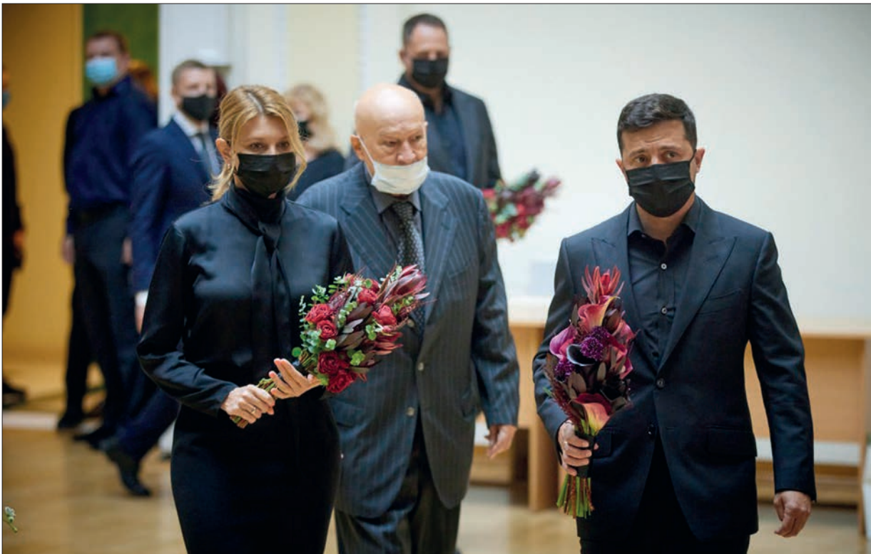
Президент України Володимир Зеленський разом з дружиною взяли участь у церемонії прощання з академіком Борисом Євгеновичем Патонем