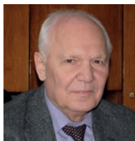
З інтерв'ю академіка-секретаря Відділення фізики і астрономії НАН України академіка НАН України Вадима Михайловича Локтева

Тепер, коли ми залишилися без Бориса Євгеновича, збереження наукового потенціалу нашої Академії, розвиток нових та трансформація наявних наукових напрямів її досліджень буде найкращим проявом шани та пам'яттю про його велич.