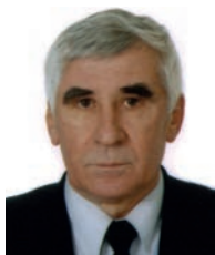
З інтерв'ю академіка-секретаря Відділення математики НАН України академіка НАН України Анатолія Михайловича Самойленка

Добра і світла пам'ять про Бориса Євгеновича Патона збережеться в серцях багатьох поколінь.