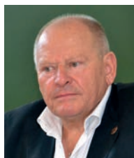
З інтерв'ю академіка-секретаря Відділення літератури, мови та мистецтвознавства НАН України академіка НАН України Миколи Григоровича Жулинського

Україна і Академія втратили Людину-епоху і Вченого-легенду. Борис Євгенович незаперечно посів почесне місце на скрижалях вічності, поруч із такими корифеями науки, як Володимир Вернадський, Михайло Грушевський. Нам усім гостро бракуватиме його академічної мудрості, державного мислення, фантастичної працездатності, життєвого оптимізму та незвичайної людської толерантності.