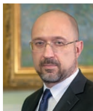
З виступу Прем'єр-міністра України Дениса Анатолійовича Шмигала

нальною академією наук. Його непереборний оптимізм та жага до пізнання надихали!