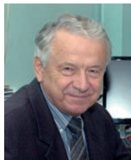
З інтерв'ю члена Президії НАН України, директора Державної установи «Інститут економіки та прогнозування НАН України» академіка НАН України Валерія Михайловича Гейця

Це не забувається, а тому наш обов'язок берегти і розвивати ті непроминальні діяння Великого Українця — вченого з високим творчим духом і потужною інтелектуальною енергією.