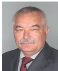
З інтерв'ю академіка-секретаря Відділення фізико-технічних проблем енергетики НАН України академіка НАН України Олександра Васильовича Кириленка

Борис Євгенович назавжди залишиться у нашій пам'яті як приклад самовідданого служіння українській науці та суспільству.