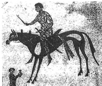
Рис. 2. Фрагмент росписи скелета Анфиестерии с изображением всадника.