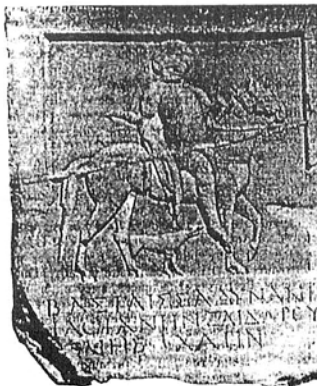
Рис. 1. Надгробие Митриана, сына Зентара, из собрания Таврического музея.

Для создания катафрактовой конницы на Боспоре были необходимы разведение и отъездка рослых коней 20 . По-видимому, они попали на Боспор из Средней Азии при передвижении сарматских племен. В пользу этого свидетельствует очевидная близость пород лошадей на боспорских рельефах и фресках, с одной стороны, и синхронных памятниках среднеазиатского изобразительного искусства, с другой 21 . Отмеченные наблюдения вполне согласуются с мнением гиннологов, допускающих влияние среднеазиатских лошадей на развитие коневодства в Северном Причерноморье.