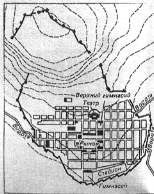
Рис. 4. План города Приены

«На западном участке раскопа театра, за амфилемой, была обнаружена мусорная насыпь, состоящая преимущественно из битых амфор. Среди них есть обломки факосских амфор с цифровыми граффити, которые датируются по шрифту IV в. до н.э.