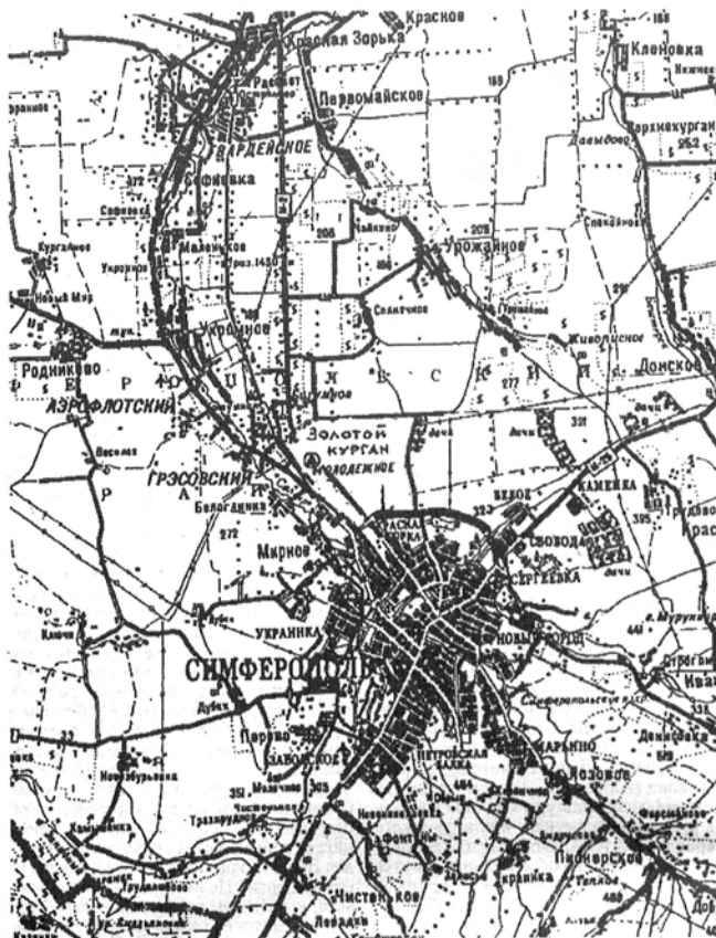
Рис. 1. Место расположения Симферопольского Золотого кургана.

миссии, были оставлены золотая пуговица и несколько фрагментов шита 13 .