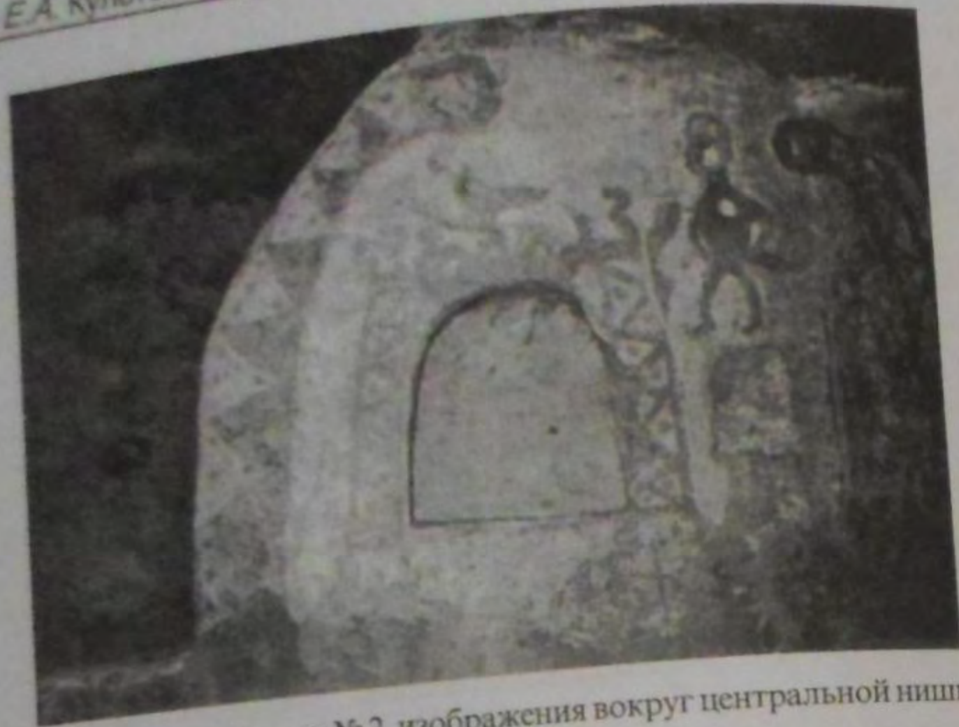
Рис.3. Расписной склеп № 2, изображения вокруг центральной ниши.