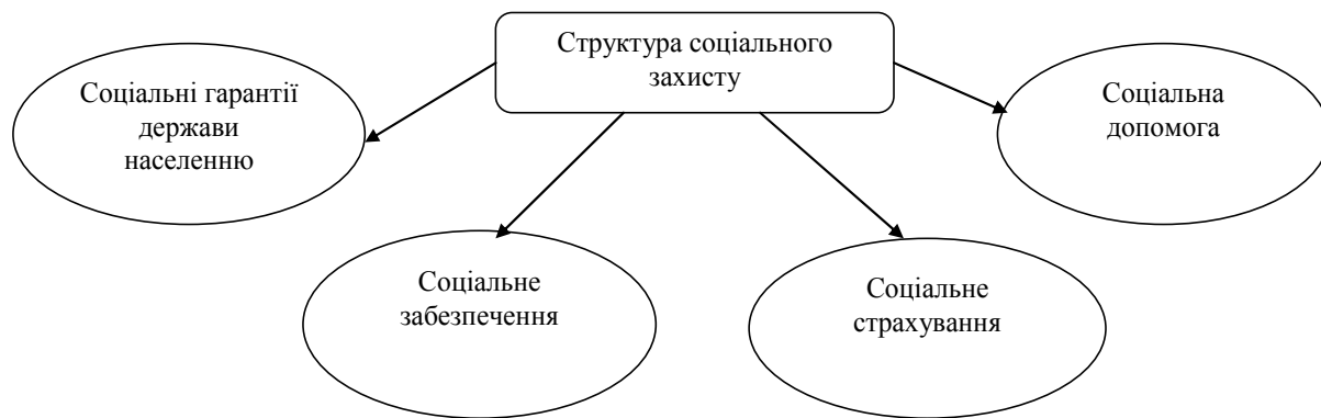
Рис. 1. Структура системи соціального захисту (сформовано авторами на основі джерела [1])

та захисту прав дітей, запобігання насильству в сім'ї, соціального захисту ветеранів війни та учасників антитерористичної операції, зокрема забезпечення їх психологічної реабілітації, санаторно-курортного лікування, технічними та іншими засобами реабілітації, житлом, надання освітніх послуг, організація поховання, соціальна та професійна адаптація військовослужбовців, які звільняються,