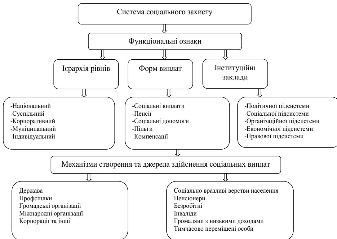
Рис. 2. Система соціального захисту населення (сформовано авторами на основі джерела [1])

осіб, звільнених з військової служби та учасників антитерористичної операції. Оскільки об'єктами та суб'єктами соціальної політики виступають, з одного боку, державні інститути, а з іншого – населення країни, то доцільно розглядати комплексну систему соціального захисту як державний інститут опіки найменш захищеного прошарку населення (рис. 2).