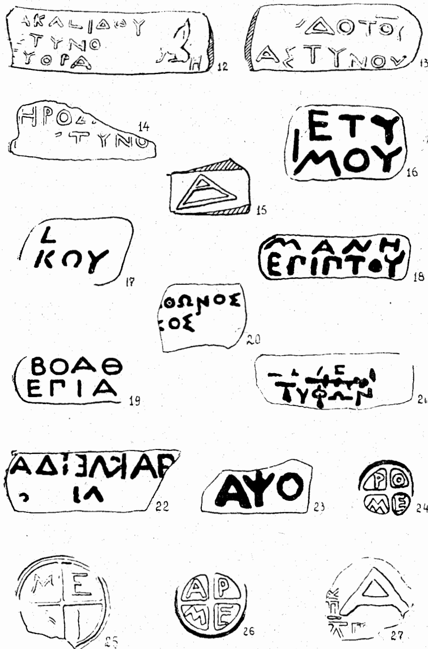
Рис. 2. Клейма на амфорной таре из городища у с. Пивденное (12 — Синопа; 13-15 — Херсонес Таврический; 16-23 — Гераклея Понтийская; 24-27 — клейма неизвестных центров).

Во втором случае разбираются лишь отдельные буквы. Клейма