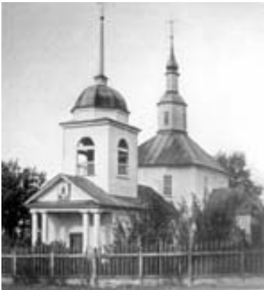
Церква св. Варвари з Новгород-Сіверського. Світлина 1916 р.

Ікона Покрови Богородиці (у кольорі) на момент її фотографування (1916 р.) С. Таранушенком була у Варваринській дерев'яній церкві Новгород-Сіверського (храм розташований на території колишньої фортеці) 2 . Розмір фотографії 10x8 см. З документальних джерел довідуємося, що С. Таранушенко протягом першої половини ХХ ст. відвідував Новгород-Сіверський кілька разів – у 1916, 1930 і 1932 рр. Під час своєї подорожі до міста у 1916 р. він досліджував і фотографував церкви – св. Миколая, св. Варвари та Покровський храм. Вочевидь, ікона була написана для іншої церкви і перенесена до храму св. Варвари, оскільки побудова останнього датується 1788 р. Церква не збереглася.