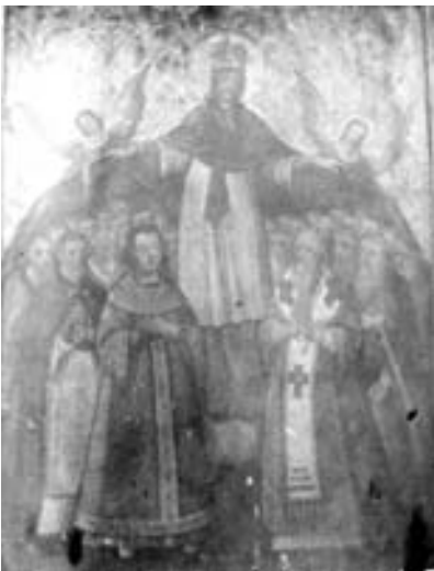
Фотографія ікони Покрови Богородиці. Світлина 1916 р.

Ікону можна віднести до унікальної пам'ятки українського живопису. Її композиційна схема для того часу була доволі традиційною. У центрі ікони ми бачимо образ Божої Матері у короні з Покровом, над яким зображені два янголи на фоні рослинного орнаменту. Під Покровом дві групи людей – світські особи (ліворуч) і духівництво (праворуч). Дійові особи на іконі зображені згідно з ієрархією. Кожне обличчя чітко промальовано.