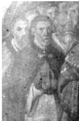
Фрагмент фотографії ікони з зображенням гетьмана І. Мазепи.