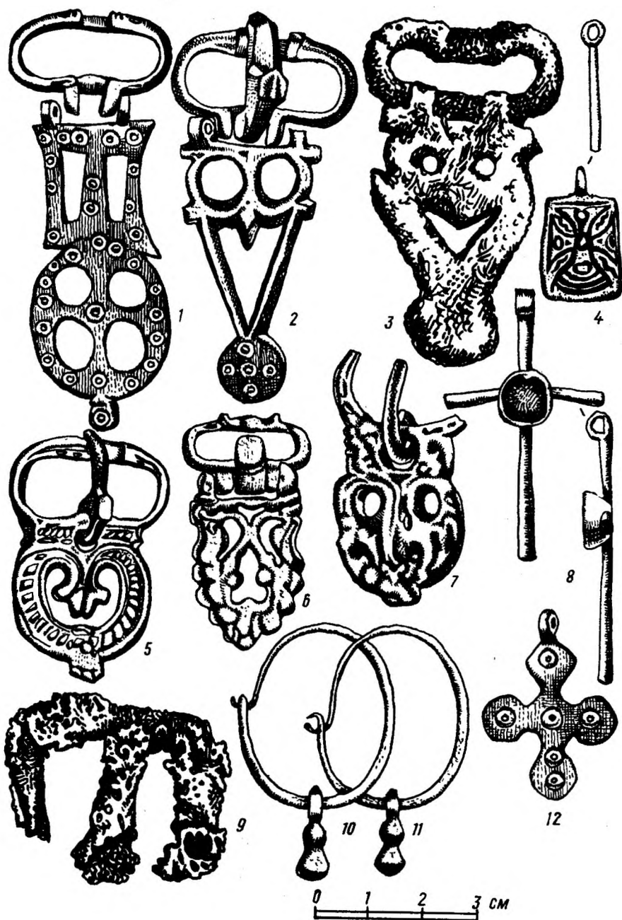
Рис. 11. Находки из склепа I/1926 г. могильника Усть-Бан.