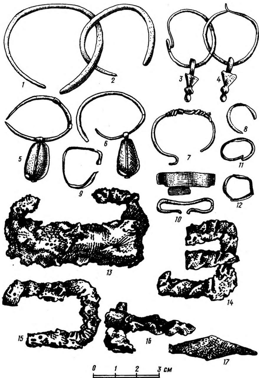
Рис. IV. Находки из скелета 2/1926 г. могильника Узень-Банг.