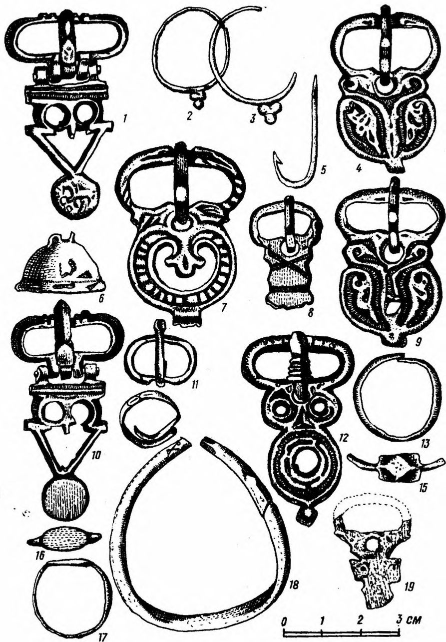
Рис. V. Находки на склепов 1/1907 г. (№№ 1-7, 15, 19); 2/1907 (№№ 8-11) и 3/1907 (№№ 5, 12-14, 16-18) могильника Усай-Баш. Раскопки Н. П. Решникова.