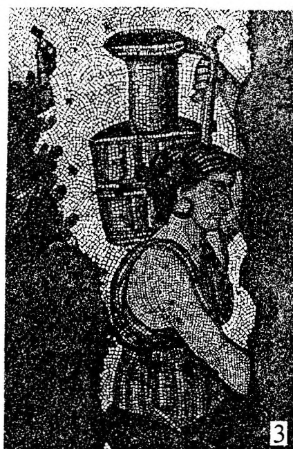
Рис. 2. Мозаики VI в. из Равенны, из апсиды церкви Сан Витале (1, 2) и из Константинополя, с пола Большого дворца (3) [по: 6, рис. 9; 57; 59].