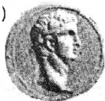
Рис. 1. Лицевые стороны боспорского статера Котиса I - 342 г.б.э. (45 г.) с портретом Клавдия и херсонесских статеров 71, 73 г.х.э. (47, 49 г.)

Первая хронологическая группа золотой чеканки несет на себе изображения головы Клавдия без каких-либо дополнительных элементов. Голова повернута вправо, в чем несомненно угадывается влияние типов боспорских статеров. Это влияние может быть конкретизировано, если сравнить портрет херсонесских статеров 47 и 49 гг. с изображением головы императора на лицевой стороне статера Котиса I, чеканенного в первый год его правления 342 г.б.э. (45 г.) — рис. 1. Этот портрет Клавдия — наиболее художественный в чеканке Котиса I и один из немногих в ней, выполненный в классическом малоазийском стиле августовских кистофоров. Несовпадение пропорций в деталях портретов и несомненно уступающий по уровню стиль херсонесского резчика все же позволяет заметить попытку придания сходства, повторение манеры передачи прически и свисающих, чрезмерно удлиненных концов диадемы. Наиболее вероятно, что именно портрет императора на этом боспорском статере стал прототипом в работе херсонесского мастера. Об ориентации херсонесской золотой чеканки на боспорскую говорит и совпадение их весовых параметров: Боспор 342 г.б.э.: 7,84 г (ГИМ, № 407), 7,85 г (Брит. муз.), 7,84 г (Эрм., № 665), 7,86 г (Берлин), след. гг. макс. 7,94 г 23 ; Херсонес: 71 г.х.э. - 7,75 г (ГИМ, № 31539), 73 г.х.э. - 7,84 г. (Берлин)