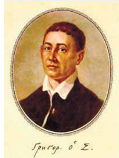
Григорій Савич Сковорода

Філософію Сковороди можна назвати ще й практичною філософією, практичною і в сенсі мовно-практичному, про що вже йшлося, і в сенсі морально-практичному. І це відповідає ще одній тенденції сучасної філософії, яка пов'язана з «реабілітацією практичної філософії», тобто етики, що робить філософію Сковороди вкрай актуальною, а самого мислителя — нашим сучасником. Понад це, Сковорода, як і Кант, віддавав перевагу практичному розуму