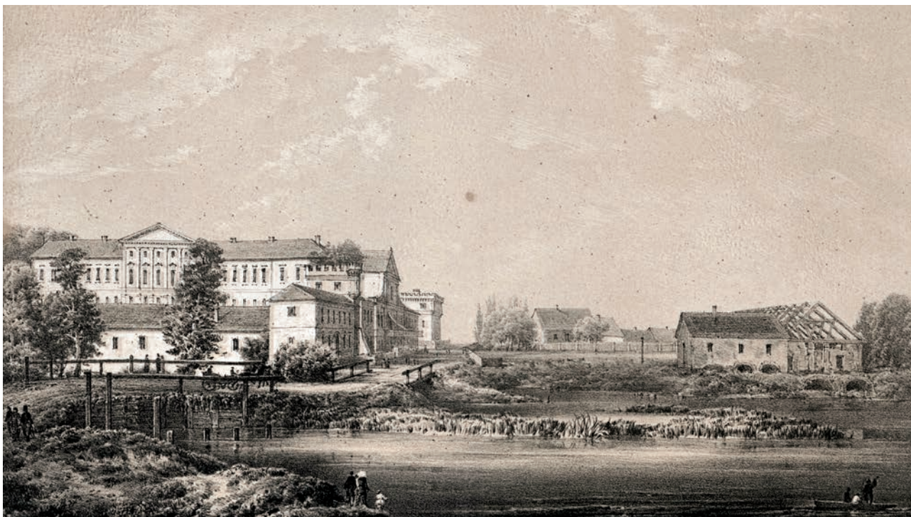
[Рис. 4. Янів. Наполеон Орда.

Як бачимо, історія Вінниччини тісно пов'язана з оборонними спорудами. На жаль, багато замків були повністю зруйновані або дійшли до нас у вигляді руїн. Усвідомлення місцевими жителями важливості збереження наявних пам'яток є ключовим завданням в питанні використання історико-культурної спадщини, особливо за умов відсутності належного регулювання зі сторони держави. Активісти та ентузіасти можуть стати рушійною силою в процесі відновлення та