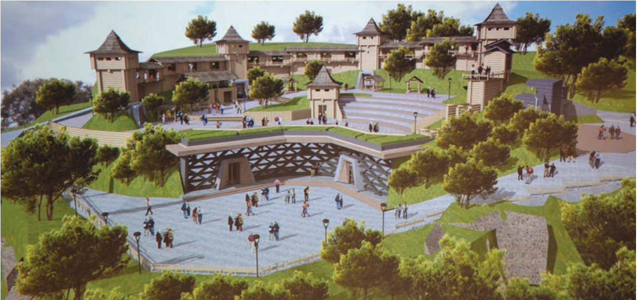
[Рис. 1. Проект-ескіз комплексу на місці Вінницького замку.

[Електронний ресурс]. – Режим доступу: https://vezha.vn.ua/yakym-mozhe-buty-vinnytskyj-zamok-na-staromu-misti-prezentovano-kontseptsiyu-istoryko-turystychnogo-kompleksu-grafika/ ]