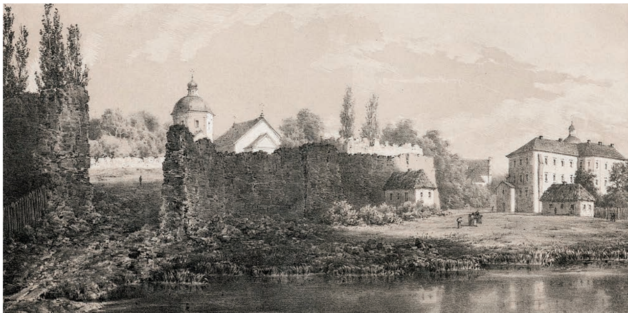
[Рис. 3. Руїни Барського замку. Наполеон Орда.

[Рис. 2. План Барського замку. Сіцинський Є. Оборонні замки Західного Поділля XIV–XVII ст.: (іст.-археол. нариси) / Є. Сіцинський. – Київ: Укр. Акад. Наук, 1928. – С. 94.]