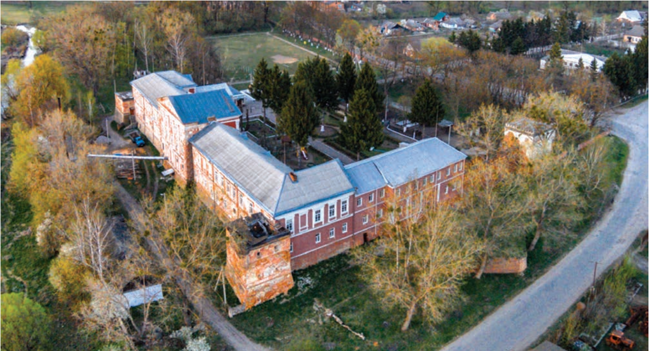
[Рис. 5. Янівський замок-палац. Сучасний вигляд. Спадщина. Янов. Замок-палац Холоневських [Електронний ресурс]. – Режим доступу: https://m-a-d-m-a-x.livejournal.com/149420.html ]