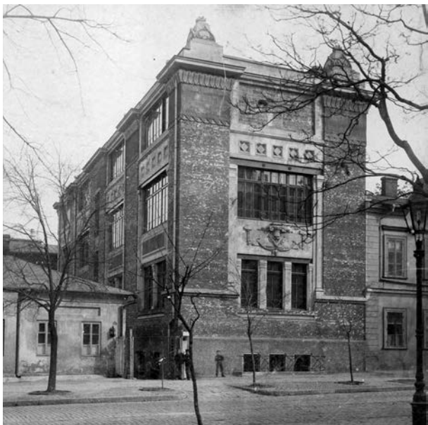
Одеське художнє училище. Фото 1910. 36. С.З. Лущика. Публікується за книгою О.М. Барковської «Товариство незалежних художників в Одесі»

У 1904 році Борис Вільямович відкрив в Одесі курси малювання і ліплення для вчителів загальноосвітніх шкіл, розробивши відповідну програму. У міру того, як почала зменшуватися кількість замовлень, особливо з початком війни, усе більше художників переорієнтовувалися на викладацьку роботу. Знищення (чи завчасний демонтаж) з початком Першої світової війни відкритого у 1913 році у Римніку (Румунія) пам'ятника О. Суворову, а потім неможливість установити його копію в Ізмаїлі – це теж важлива обставина, яка, на мою думку, певним чином пояснює більш інтенсивну роботу Бориса Едуардса у пізніший період як педагога 11 .