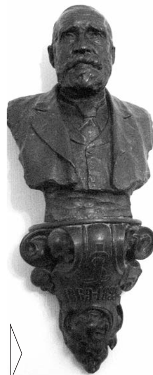
Б.В. Едуардс. Бюст Л.-Д. Іоріні. 1911. Бронза. В. 111 см. Одеське художнє училище