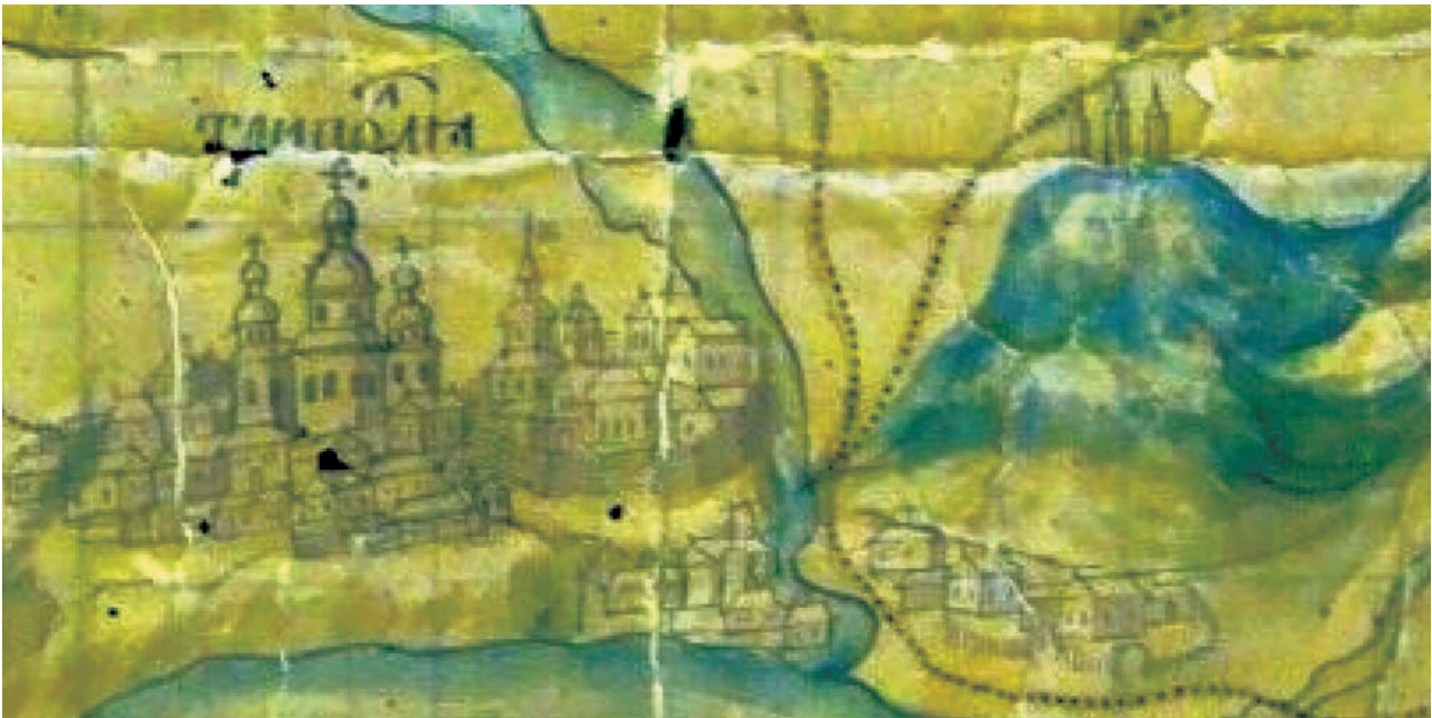
Іл. 7. Зображення Трипільля на мапі XVII ст.

Між 1596 і 1600 рр. до містечка прибували піддані-втікачі з Овруччини, Житомирщини, Брацлавщини, зокрема з маєтків шляхтичів Якуба Павші, Юрія Струся і князя Юрія Друцького-Горського 49 . У 1600 р. власники Трипільля впорядковували кордони своєї маєтності зі сторони Обухівщини. Її тодішній власник – Павло Монвид-Дорогостайський подав скаргу до суду на Федора, Гапона, Ждана і Федора молодшого Трипольських за порушення кордонів своєї маєтності. Справа закінчилася декретом Люблінського трибунальського суду від 12 червня 1600 р., згідно з яким урядники Київського підкоморського суду мали провести розмежування цих маєтностей, що відбулося 24-27 липня 1600 р. за участі коморника Шимона Уруцького, але незадоволенні розмежуванням Трипольські подали апеляцію до трибунальського суду. Розлогий опис цієї справи з усіма подробицями вміщено до книги Київського підкоморського суду 50 . У 1602 р. П. Монвид-Дорогостайський знову скаржився до Люблінського трибунальського