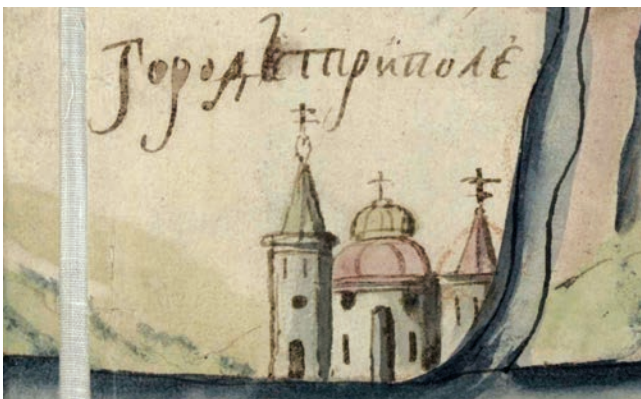
Іл. 5. Фрагмент карти Київської губернії. XVIII ст. (РГАДА, ф. 192, оп. 1, Киевская губ., № 5; http://rgada.info/geos2/zapros.php?nomer=947 )

Король своїм привілеєм надавав Дідовичам-Трипольським право на осадження і заселення містечка вільними людьми, ремісниками та прибульцями з різних місць. Трипільлю надавалося магдебурзьке право за прикладом інших міст, але без будь-якої конкретизації і взірця: «В котром месте надаемъ вольность и право майдеборское прикладомъ и порядкомъ такимъ, яко ся в ынших местахъ заховуеъ, яко они похочуть». Інакше кажучи, від власників Трипільля