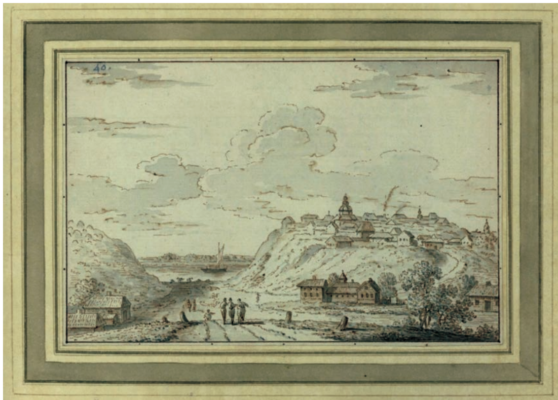
Іл. 9. Видяд Трипілля 1781 р., художник Йоган Генріх Мюнц

підданими з сіл Коцовщина і Мамче до Зеревщини, другий позов подали в с. Лукашовка через погрози (похвалки) Парфена Трипольського, третій у м-ку Межиричка по Івана Новоселицького через збіглих підданих 124 . 29 серпня 1646 р. брати Трипольські знову подали позов у с. Збранков, маєтності Парфена Трипольського, через якісь взаємні суперечки 125 , а 3 вересня вони поклали позов у с. Черніговці по пана Скіпора, якому на той час належало це село 126 . У той же час вони скаржились на Христину Тишкевичову через те, що їхні піддані збігли з с. Клочки до її с. Дідовщина або Христинівка 127 . 27 лютого 1646 р. Олександр Солтан скаржився на братів Трипольських через те, що вони виїжджали озброєними і перешкоджали розмежуванню його Болотковських ґрунтів з с. Коцовщина згідно з трибунальським декретом 128 . Після цього наступного дня возний записав зізнання до урядових