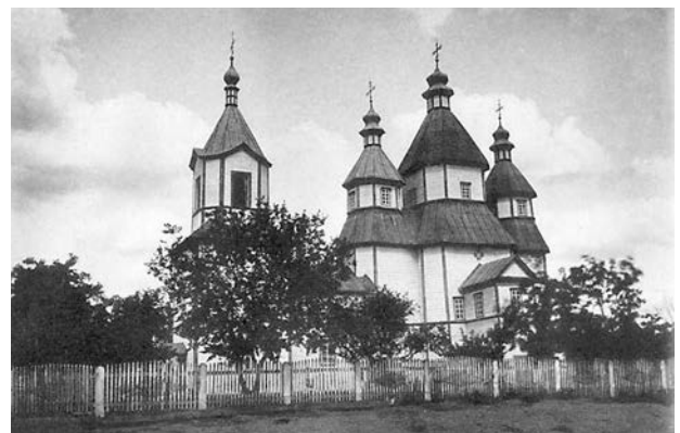
Іл. 6. Введенська церква 1797 р. (Павлуцкий Г. Деревянные и каменные храмы. К., 1905, альбом, № 17)