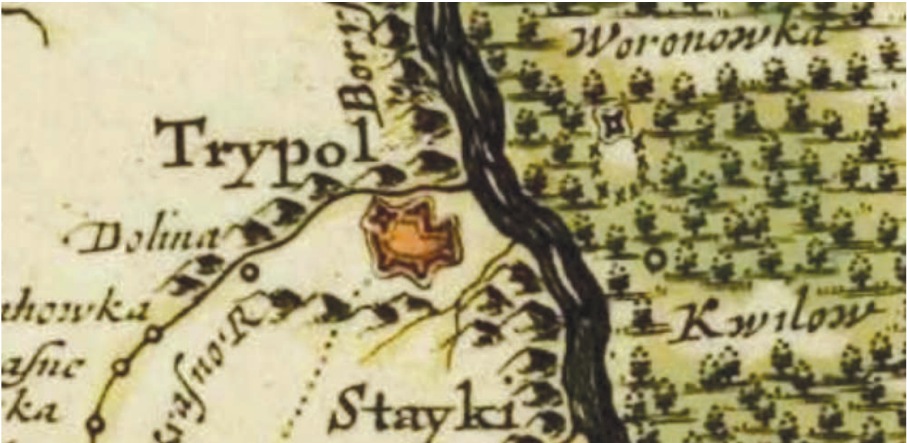
Іл. 8. Трипільля на мапі Г.-Л. де Боплана 1640 р.

шений був покинути Трипільля. На той час він уже мешкав в Овруцькому повіті у с. Пелчі, звідки 4 січня 1629 р. написав лист київському каштелянові Гаврилові Гостському з проханням видати його збіглу піддану 82 .