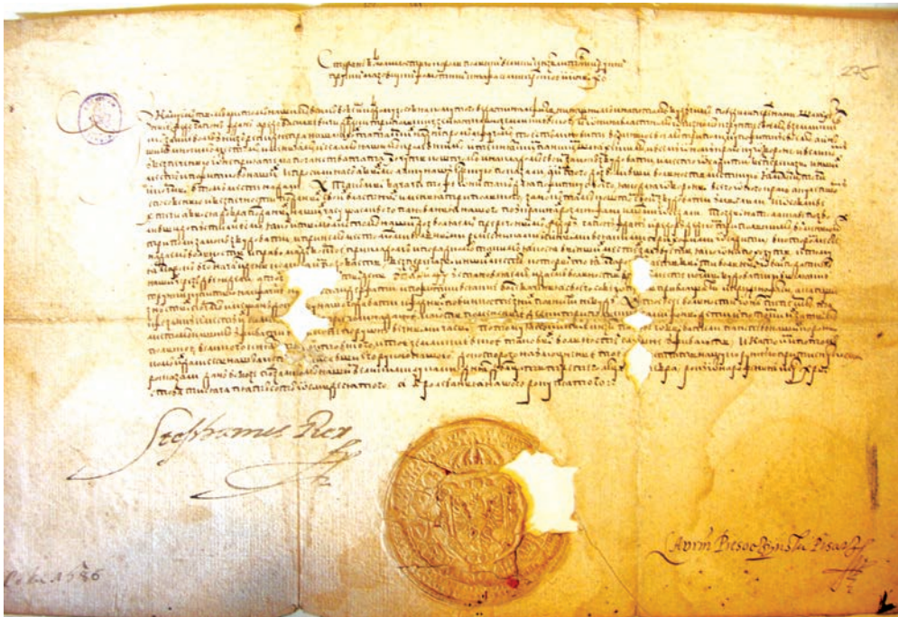
Іл. 3. Привілей на магдебурзьке право Трипіллю 1580 р. Оригінал

На відміну від більшості тогочасних документів, вписаних до книг королівської канцелярії, даний привілей написаний не латиною чи польською мовою, а кирилицею, мабуть, на прохання власників Трипілля. Палеографічний аналіз показує, що це оригінал, писаний на пергаменті, засвідчений підписами короля Стефана Баторія та писаря Руської (Волинської) канцелярії Лаврентія Пісочинського, а також печаткою Коронної канцелярії. Документ нині зберігається у Державному архіві Польщі в м. Краків (відділення на Вавелі), у фонді «архів князів Сангушків», має задовільний стан збереження, але в кількох місцях текст пошкоджений. При публікації у квадратних дужках нам вдалося реконструювати окремі втрачені місця тексту (Іл. 3, 4).