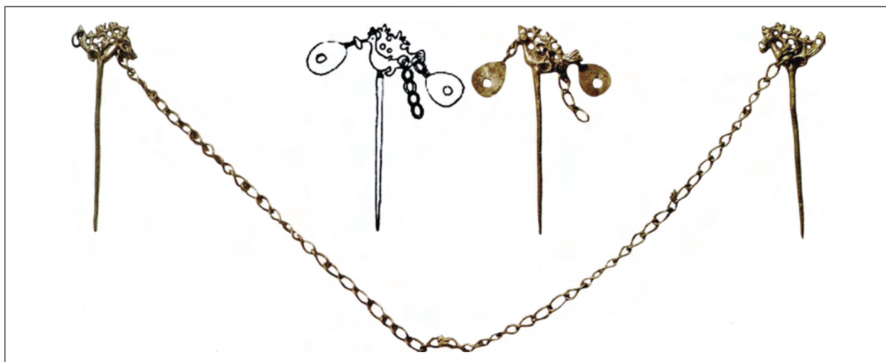
Рис. 2. Виявлені в Херсонесі булавки з орнітоморфним навершям за Т. Ю. Яшаєвою та ін. (фото) і Л. Г. Колесніковою (прорисовка)