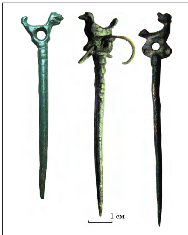
Рис. 5. Булавки із зооморфними навершнями з інтернет-ресурсів, пов'язаних із обігом рухомих археологічних пам'яток (права знахідка у джерелі запозичення не масштабована)

Слід зауважити, що долучення даних зі згаданих сайтів дійсно суттєво впливає на оцінку ролі й місця софіївсько-борщагівської знахідки.