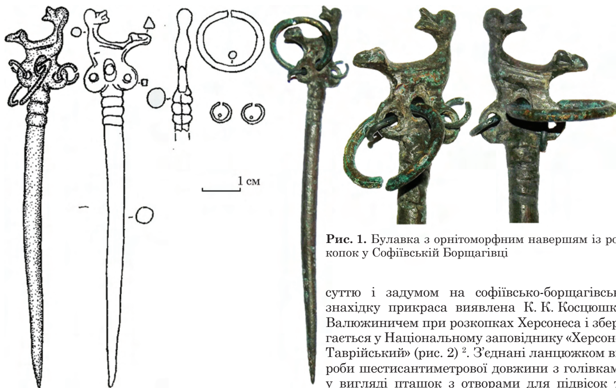
Рис. 1. Булавка з орнітоморфним навершям із розкопок у Софіївській Борщагівці

жалось обмеженим дном шляху (Рыбаков 1984, с. 317). Останній із перерахованих речей і присвячена пропонує публікація 1 .