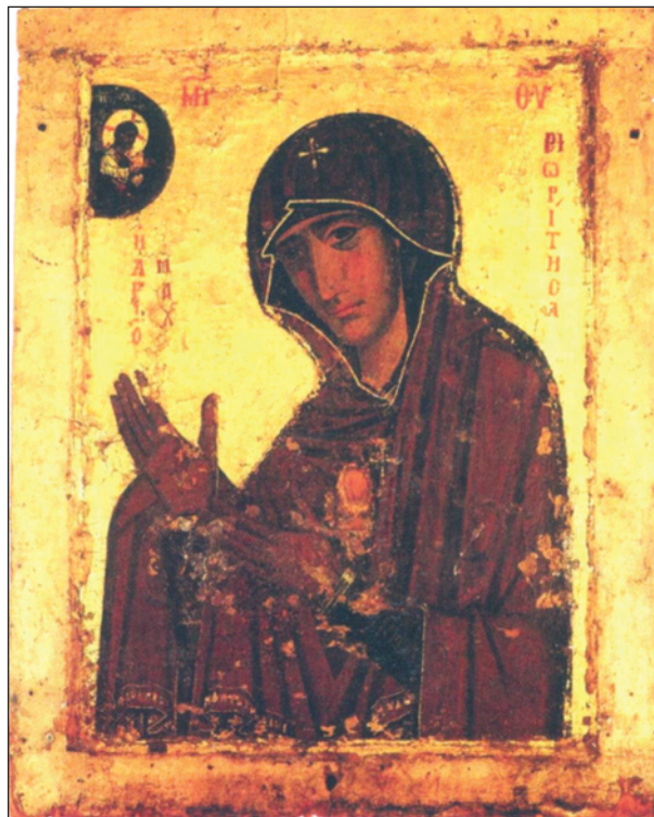
Рис. 2. Богоматір Агіосорітисса (Махеріорітисса). Кінець VIII—IX або друга половина XI ст. Монастир Махерас, Кіпр (Sophocleous 2014)

Зображення Богоматері на іконці відповідає іконографічному типу Богоматір «Агіосорітисса» — Ἀγιοσορτίτισσα , за яким її зображують без Немовляти, на повний зріст або по груди, обличчям до глядача, у повороті в три чверті або у профіль, з простягнутими у молінні до Христа руками. Його зображення у вигляді напівфігури чи благословляючої десниці у сегменті неба у верхньому куті (рис. 2; 3) не є обов'язковими, як, наприклад на камеї з геліотропу в Художньому музеї Волтерса у Балтіморі (Ross 1962, р. 101—102, nos. 122, 123; Evans, Wixom 1997, р. 165—166, 180, 332—333, nos. 112, 113, 135, 226; Бельтинг 2002, илл. 188).