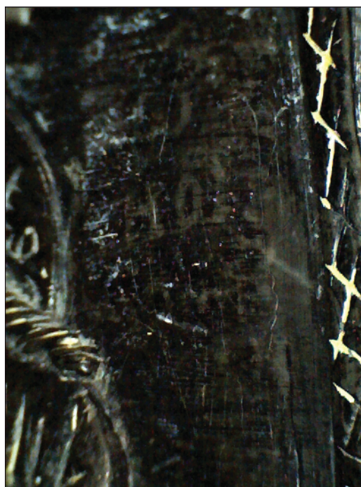
Рис. 4. Іоанн Хреститель. Стеатит. Друга половина — кінець XII ст. Київ, розкопки Я. С. Боровського, 1988 р. Музей історії міста Києва: а — загальний вигляд; б — фрагмент зі слідами мальованого напису

каменю найрізноманітнішої якості. Як тепер доведено, золотіння і поліхромний розпис на мініатюрних витворах зі слонової кістки та інших мінералів, деталях архітектурного різьбленого декору і скульптури мали багатвікову традицію. Їх продовжували використовувати і в середньовізантійський період на предметах особистого благочестя з кістки й каменю (Соннор 1998). Золото, що мало сакральне значення, широко застосовувалося в оздобленні храмів і при виготовленні богослужбових предметів (Аверинцев 1973, с. 46; Дедюхина 2003, с. 201). Використання золотіння на давньоруських кам'яних іконках домонгольського часу достеменно недоведене. Відома ж за фото двостороння іконка зі св. Іоанном і св. Захарієм із слідами золотіння, вочевидь, є візантійською, зробленою зі стеатиту. До того ж, вона пізніша, ніж кінець XII ст., яким її датує Т. В. Николаєва. Іконка походить з церкви Св. Микити на Торговій стороні у Новгороді і зберігалася в новгородському єпархіяльному Древлесховищі, але тепер даних про її місцезнаходження немає. За описом іконка — з зеленувато-сірого («попелястого кольору») каменю із золотінням (Николаєва 1983, с. 72, табл. 20: 1, № 103), що відповідає кольору стеатиту і традиції оздоблення золотом візантійських іконок з каменю і кістки. В. Г. Пуцко припускає, що, як і інші новгородські іконки з елементами палеологівської