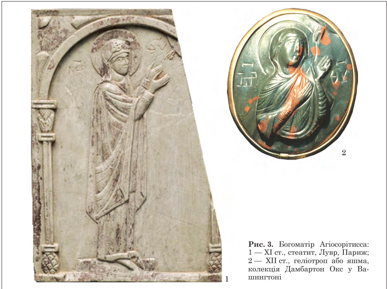
Рис. 3. Богоматір Агіосорітисса: 1 — XI ст., стеатит, Лувр, Париж; 2 — XII ст., геліотроп або яшма, колекція Дамбартон Окс у Вашингтоні

Богородиці в Константинополі. Оскільки цей епітет пов'язаний саме з назвою капели, а не з церквою, В. Зайбт запропонував відмовитися від епітету «Халкопратійська» (Seibt 1987, s. 36), якій використовували для цього типу деякий час Н. П. Кондаков та інші (Кондаков 1915, с. 294—315).