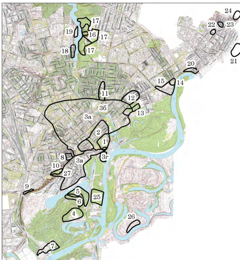
Рис. 3. Территория древнерусского Чернигова и поселения расположенные рядом с городом: 1 — Детинец Чернигова; 2 — Окольный град; 3 — открытые посады (а — на правом берегу р. Стрижень; б — на левом берегу р. Стрижень до появления укреплений Предградья; в — участок Подола на юг от Третьяка под краем террасы р. Десна; г — участок Подола в районе Речного вокзала); 4 — участок Подола (пос. Святое); 5 — участок Подола (пос. Церковище); 6 — участок Подола (пос. Пролетарский Гай—2); 7 — пос. Микулино; 8 — загородный княжий двор в районе храма на ул. Северянской; 9 — пос. Нефтебаза; 10 — курганы на Болдиных горах; 11 — курганы на «Кладбище в Березках»; 12 — курганы на ул. Шевченко; 13 — пос. Горсад; 14 — гор. Гюричев; 15 — открытый посад Гюричева; 16 — гор. Яловщина; 17 — посады гор. Яловщина; 18 — пос. Стрижень 2; 19 — пос. Стрижень 1; 20 — пос. Бобровица 1; 21 — пос. Юрков хутор; 22 — пос. Кленовое; 23 — пос. Кукашаны; 24 — пос. Яцева гора; 25 — участок Подола (пос. Кораблище); 26 — пос. Глушец; 27 — монастырь в Ильинском овраге

нистрации города и княжества. На участках, приближенных к западной, северной и восточной границам Предградья, на 1239 г. так и не успела появиться регулярная застройка. Возникает вопрос, для чего были построены укрепления такого размера? Каким образом должна была осуществляться их оборона? Для кого или для чего в пределах города существовали свободные участки? На один из ответов указывают описанные выше материалы разведок в пойме р. Десны. Не все горожане проживали в пределах укреплений. В случае военной угрозы население покидало свои строения и с движимым скарбом укрывалось за крепостными стенами.