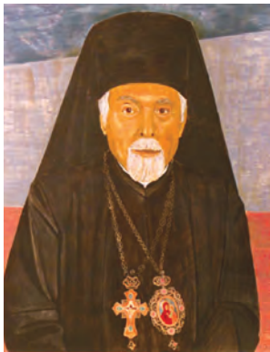
Світлина митрополита Анатолія Дублянсько-

Окупація України у 1944 році радянськими військами змусила залишити Батьківщину та податися в еміграцію велику кількість людей, серед яких були ієрархія, духовенство та віряни УАПЦ. Емігрував також і Анатолій Захарович Дублянський (пізніше – митрополит Анатолій), про що дізнаємося з його автобіографії «Шляхи мого життя» 4 . Приймаючи активну участь у формуванні церковно-релігійного життя закордоном, Анатолій Захарович розпочав також збирати свою власну бібліотеку і таким чином за майже 50-літній період перебування в Німеччині