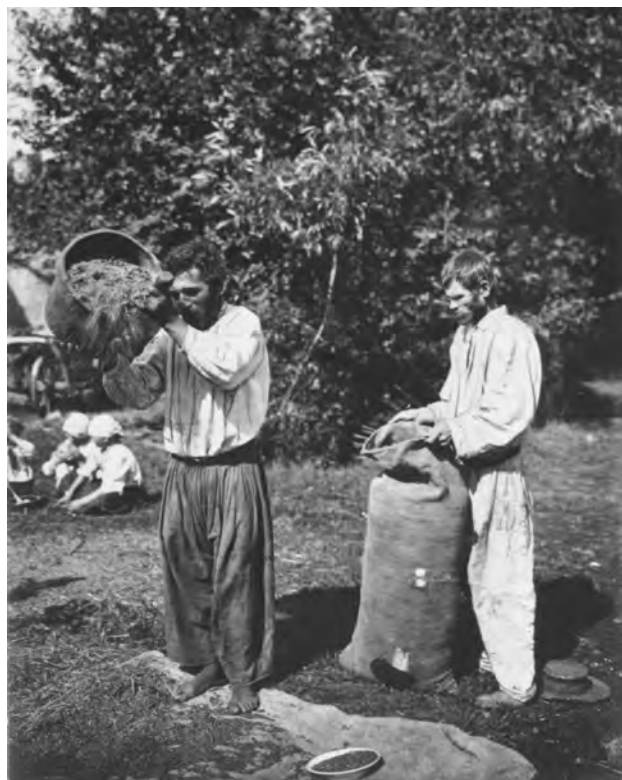
Провіювання зерна. Київська губернія. Початок XX ст.

«Здесь везде – низкие луга в половодье, заливаемые водою из р. Тетерева и других впадающих в нее рек и речек. Из оставшейся после весенних разливов воды на этих низких лугах образуются болота и озера, порастающие лозою и болотными травами, совершенно негодными в корме скоту. В некоторых местах эти болота и озера с года на год увеличиваются числом и расширяются в объеме, превращая обширные луга в бесполезные водные пустыни. Такие же болота, часто довольно значительные, простираются от р. Тетерева до р. Здвиже и занимают все восточное пространство между этими реками. Болота тетеревские соединяются с одной стороны с приднепровскими болотами, а с другой выходят низинами до р. Ирши и вверх довольно широкою полосой, по границе Овручского уезда, до р. Рольши» 5 .