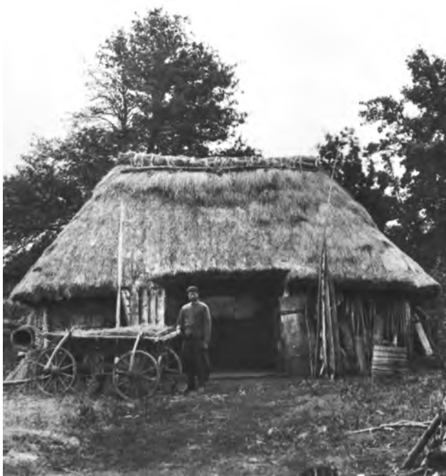
Сільська садиба. Київська губернія. Кінець XIX – початок XX ст.