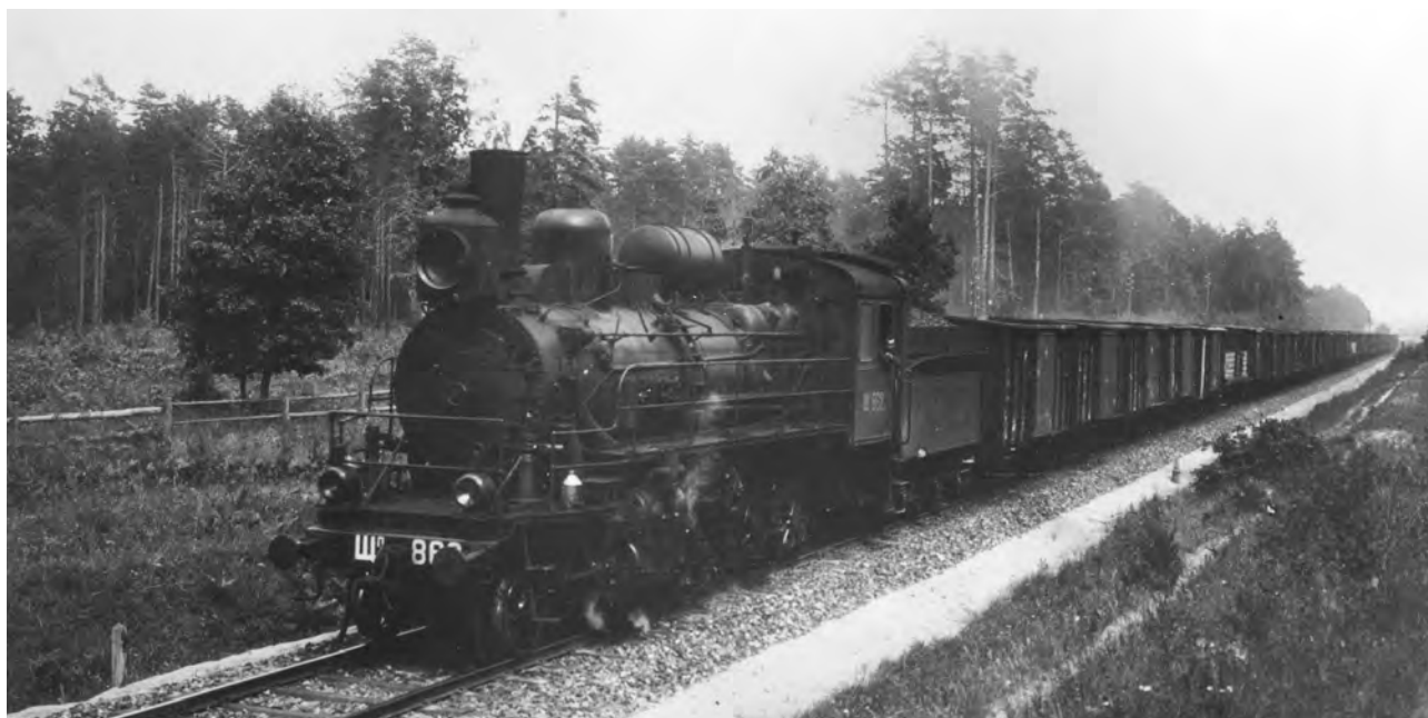
Рух потягу на одній із дільниць Південно-Західної залізниці. Київська губернія. Початок XX ст. (ЦДКФФА – 2 – 134581)