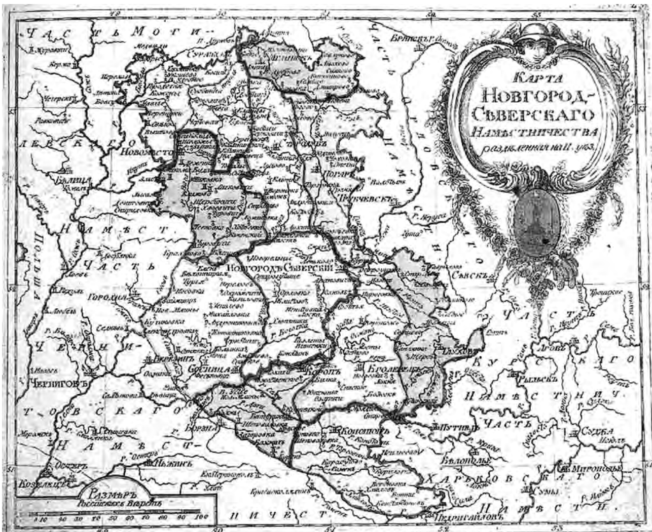
Мал. 1. Карта Новгород-Сіверського повіту.

У даній роботі окреслимо розвиток ремесла у Ніжині у 60-х рр. XVIII ст., головну увагу присвятивши першому етапу корпоративної ієрархії – учнівству. За основне джерело використаємо