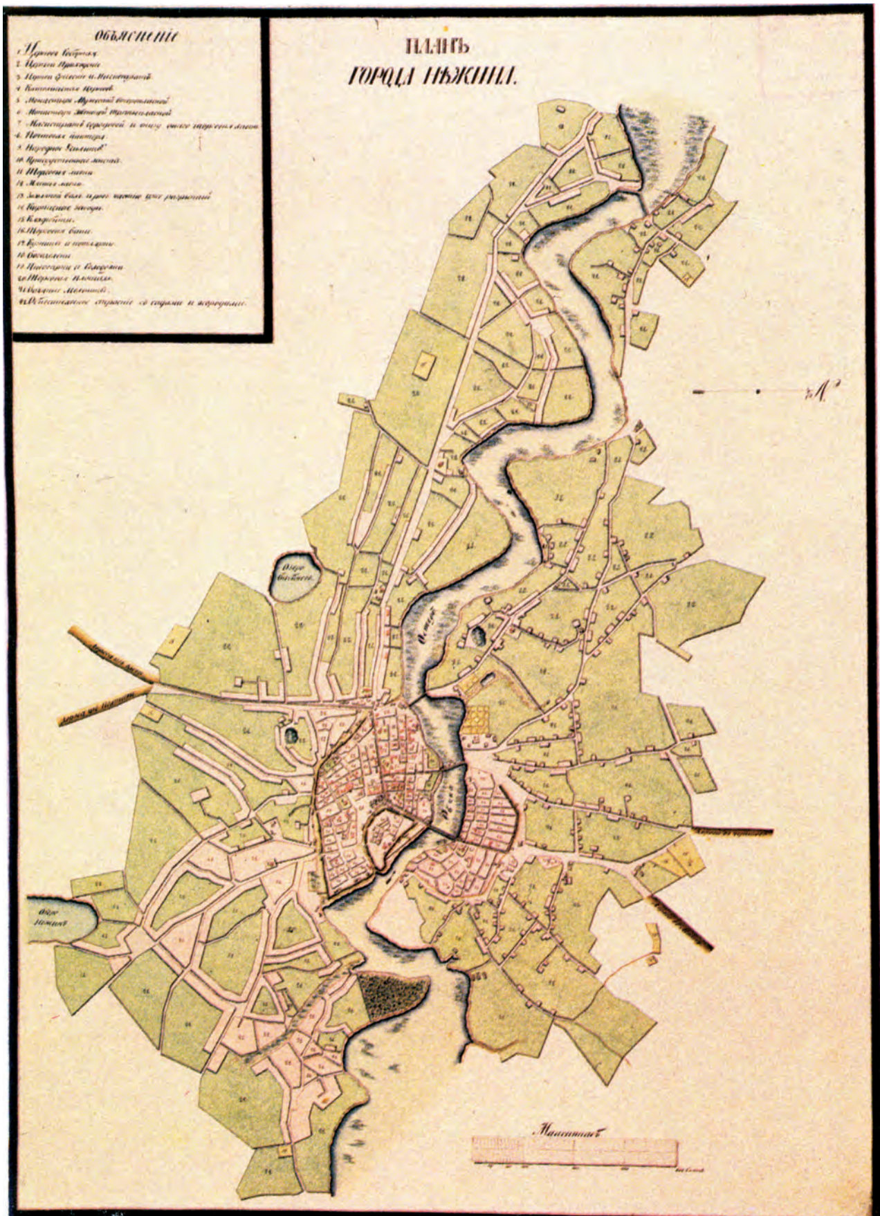
Мал. 3. План міста Ніжина. Початок XIX ст.