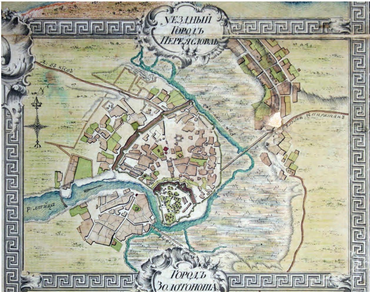
Мал. 4. План міста Переяслава на мапі Київського намісництва. Кінець XVIII ст.

Витримавши всі тяготи кількарічного учнівства, отримавши фах, можна було переходити до наступного щабля цехової ієрархії. Завершення учнівства фіксувалося в цехових книгах. Воно називалося визвілок і полягало у сплаті певної суми «кору за визвілок» на загальних зборах «при всей братіи» 25 , «при всей сходці» 26 . Учень ставав вільним від зобов'язань «и волному где пожелаеь стати воленьзостаеь» 27 , переходив на наступний щабель цехової ремісничої ієрархії – підмайстерство.