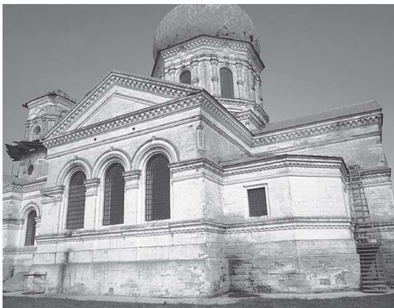
Церква Костянтина і Єлени в селі Костянтинівка (до реставрації)