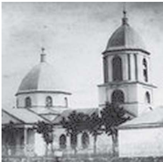
Свято-Миколаївська церква села Барماشове (Засілля) (1912 р.)