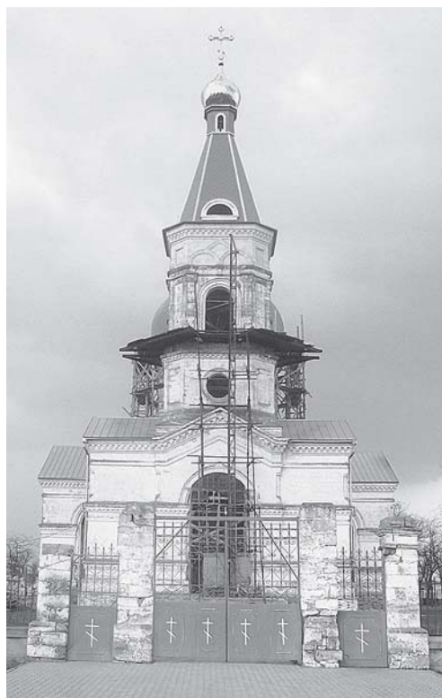
Церква Костянтина і Єлени в с. Костянтинівка (2016 р.)