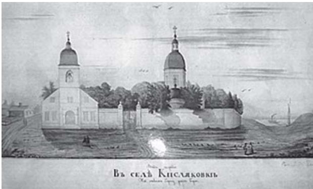
Християнська церква в ім'я Спаса у Кисляківці

вництва церков та храмових споруд населених пунктів Жовтневого (нині Вітовського) району Миколаївської області.