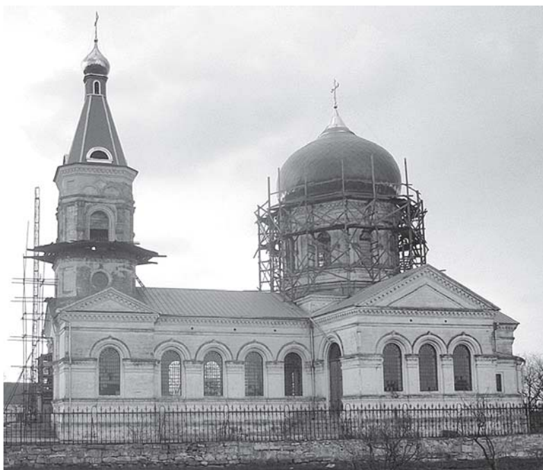
Церква Костянтина і Єлени в с. Костянтинівка (2016 р.)