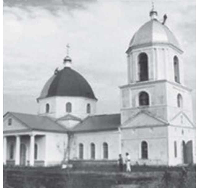
Свято-Миколаївська церква с. Бармашове (сучасний вигляд)

В 1998 р. Священний Синод УПЦ (журнал № 40 від 29.07.1998 р.) прийняв рішення про заснування в храмі чоловічого монастиря. Ця дата вважається днем народження святої оби-