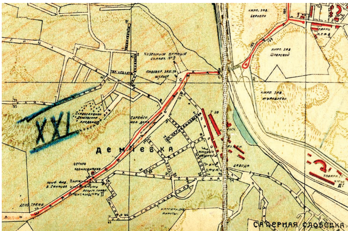
Васильківська лінія Деміївського трамвая на карті Києва 1914 р.