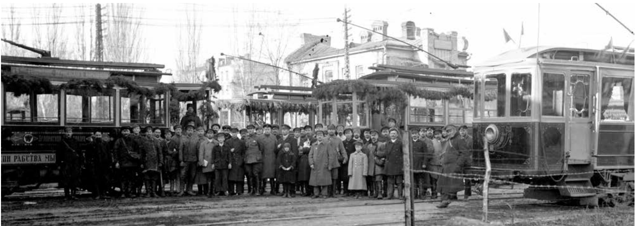
Трамвай маршруту № 10 на колишній лінії Деміївського трамвая, за рік до її остаточного закриття. 1979 р.

Колишні вагони Деміївського трамвая після передачі їх до київського трамвайного підприємства. Справа — колишній салон-вагон Д. С. Марголіна. Бл. 1924 р.