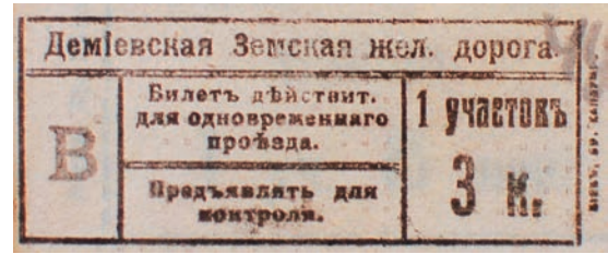
Квиток на Деміївський трамвай.