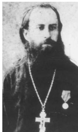
Леонід Іванович Гошкевич

М.І. Гошкевича переїхати до Херсона і зайняти посаду секретаря губерньського Статистичного комітету. Вже у перший рік свого перебування в місті В.І. Гошкевич організує в структурі комітету Археологічний музей. В 1898 р. музей переходить до відомства Херсонської губерньської вченої архівної комісії, співзасновником якої також був В.І. Гошкевич.