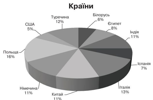
Рис. 1. Географічна структура зовнішньої торгівлі товарами у 2017 р.

Статистичні дані, представлені Державною службою статистики України, дають можливість дійти висновку, що для формування зовнішнього сектору економіки й зміцнення експортного