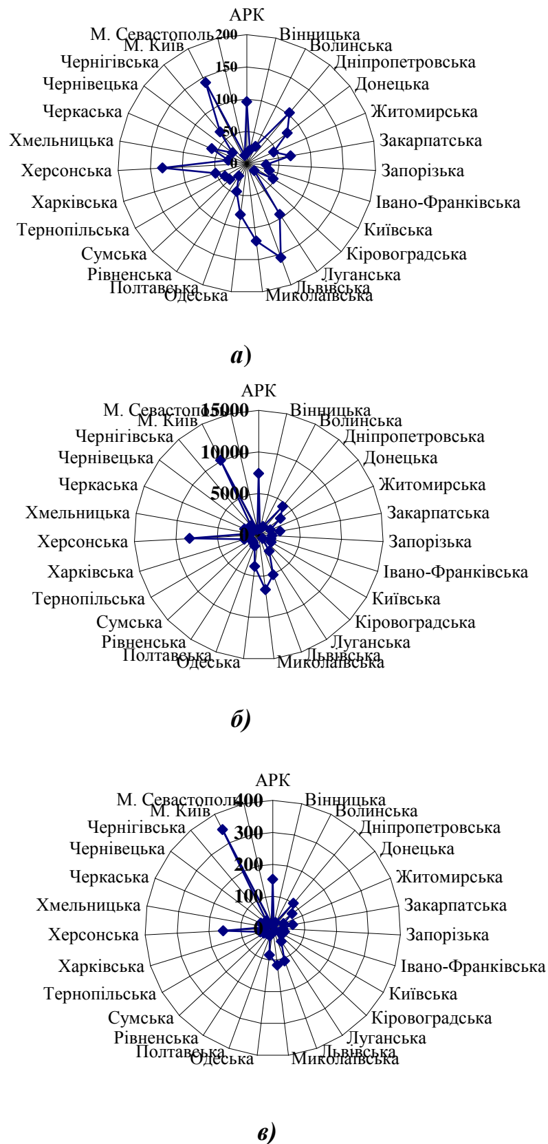
Рис. 2. Територіальні відмінності розвитку готелів та інших місць для тимчасового проживання по регіонах, 2009 р.: а – кількість готелів; б – кількість номерів у готелях; в – житлова площа всіх номерів