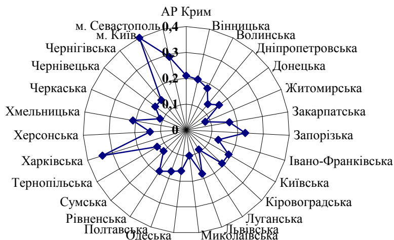
Рис. 3. Коефіцієнт використання місткості готельного комплексу *

На наявність цих елементів інфраструктури особливо варто звернути увагу нині, коли Україна активно готується до зустрічі туристів, які мають приїхати у зв'язку з проведенням фінальної частини Євро-2012 з футболу на території чотирьох міст. Останнє зумовлює необхідність активізації розвитку готельної мережі. Якщо протягом 2004–2006 років абсолютний приріст готелів становив 31 одиницю, то за 2007–2009 роки – 52 одиниці. Пік зростання припав на 2009 рік, коли за один рік загальна кількість готелів, мотелів, готельно-офісних центрів збільшувалася на 2,4% [5, с. 144].