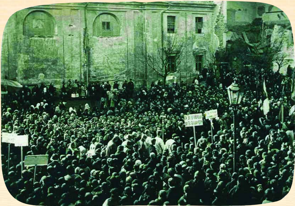
Мітинг жителів м. Станіслава на підтримку проголошеної у Львові ЗУНР. Листопад 1918 р. Публікується вперше

могил і встановили на них поіменно кам'яні хрести воякам УСС-УГА.