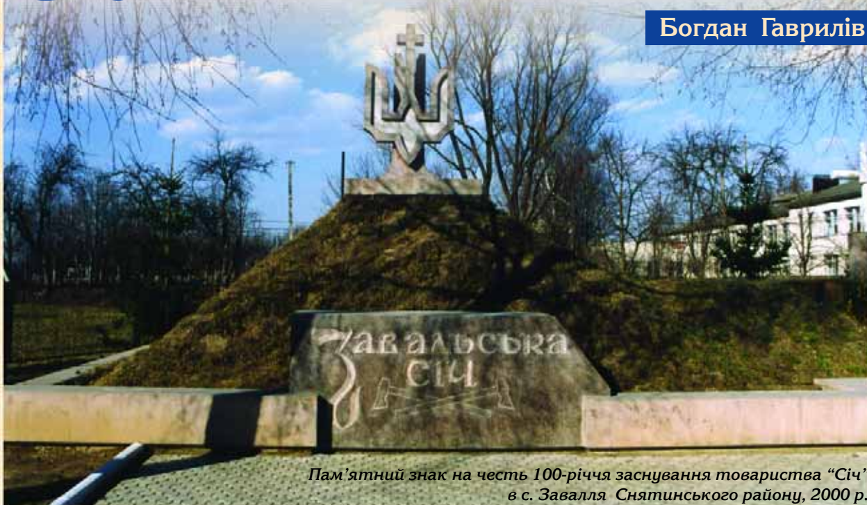
Пам'ятний знак на честь 100-річчя заснування товариства "Січ" в с. Завалля Снятинського району, 2000 р.

Важливою віхою національного відродження в Галичині було створення у 1900 р. в селі Завалля на Снятинщині першого в краї молодіжного спортивно-військового товариства "Січ", яке заснував відомий громадсько-політичний діяч Кирило Трильовський. Це товариство, як і молодіжні організації "Сокіл" та "Пласт", стали популярними серед української молоді. Пізніше їх учасники, маючи належну військову підготовку, поповнили ряди УСС та створеної в 1918 році Української Галицької Армії (УГА).