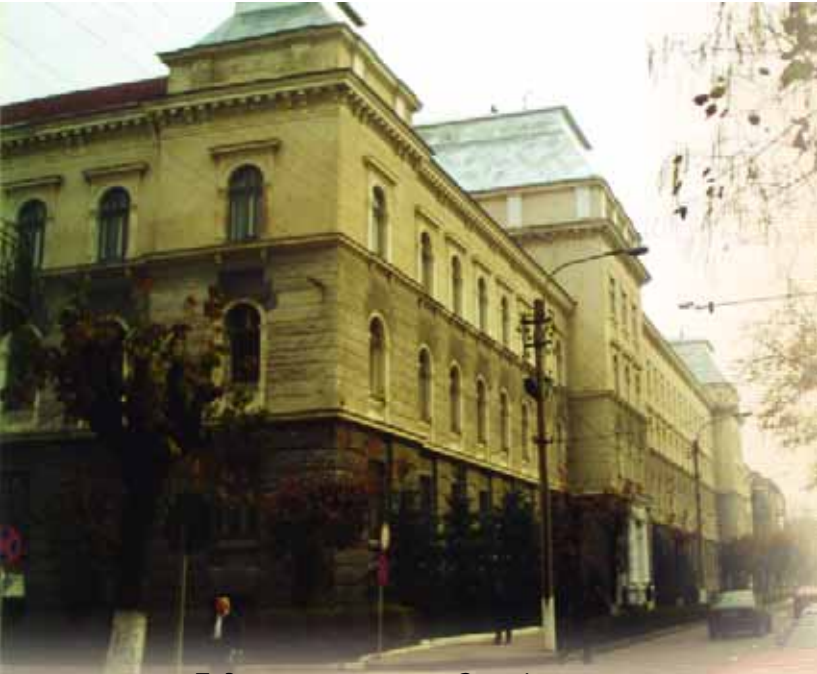
Будинок колишнього Станіславського окружного суду, де в 1919 р. перебували установи Державного Секретаріату ЗУНР (вул. Сахарова, 15)

Один з найкращих пам'ятників на честь ЗУНР в Україні було урочисто відкрито в Івано-Франківську на вул. Грюндвальській, біля колишнього будинку Уряду ЗУНР 1 листопада 2003 року. Гранітний монумент з бронзовими барельєфами видатних діячів ЗУНР Євгена Петрушевича, Костя Левицького, Лева Бачинського і Дмитра Вітовського встановлено на відзначення столиці ЗУНР в Станіславі та ухвали Української Національної Ради 3 січня 1991 року про Злуку ЗУНР з УНР (скульптор Володимир Довбенюк). Пам'ятник збудовано за ініціативою та за кошти патріота і педагога з Прикарпаття п.Володимира Войцюка. Історичну довідку підготував автор ідеї проекту, історик-краєзнавець Богдан Гаврилів, який запропонував і місце для його встановлення.