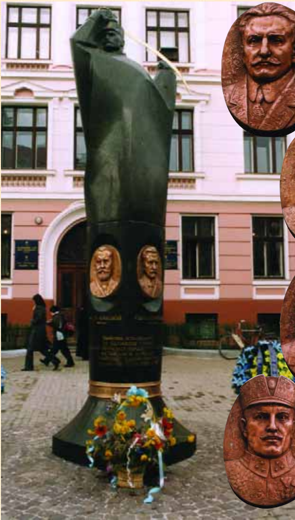
Пам'ятник на честь 85-річчя ЗУНР, встановлений у м. Івано-Франківську 1 листопада 2003 р.

з балкону приватного будинку, який зберігся на вул. Матейка, 27.