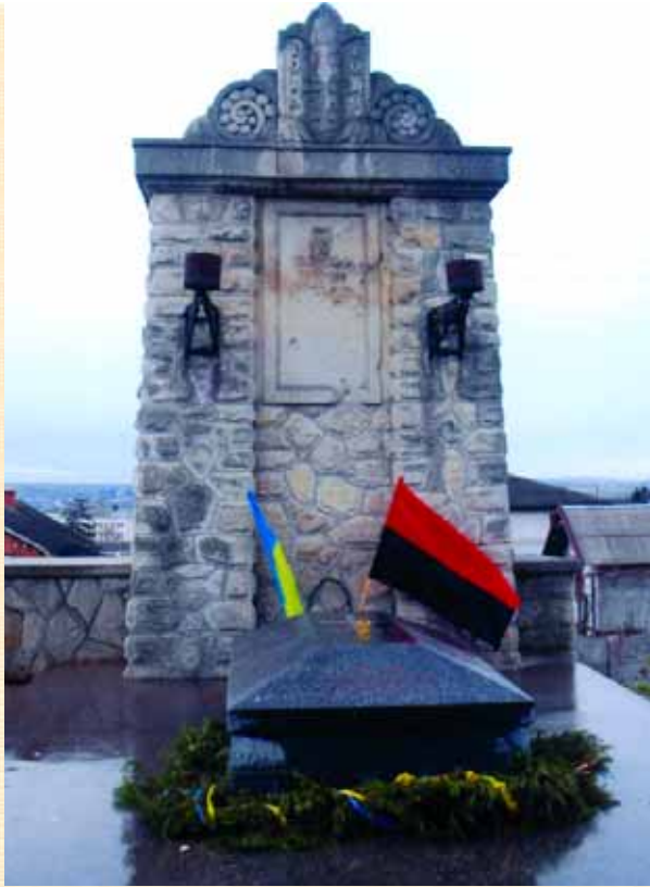
Пам'ятник стрільцям УГА в Рогатині

гербом. Були також дві козацькі шапки, шаблі і полковницька булава Д. Вітовського. Їх поховали на центральному цвинтарі тимчасово, сподіваючись, що з часом їх останки буде перевезено на рідну землю. Але цей час настав не скоро. Лише 1 листопада 2002 року на Личаківському цвинтарі у Львові українська громада урочисто провела перепоховання урн з прахом Є. Петрушевича, Д. Вітовського, Ю. Чучмана, встановивши на їхніх могилах пам'ятні дошки.