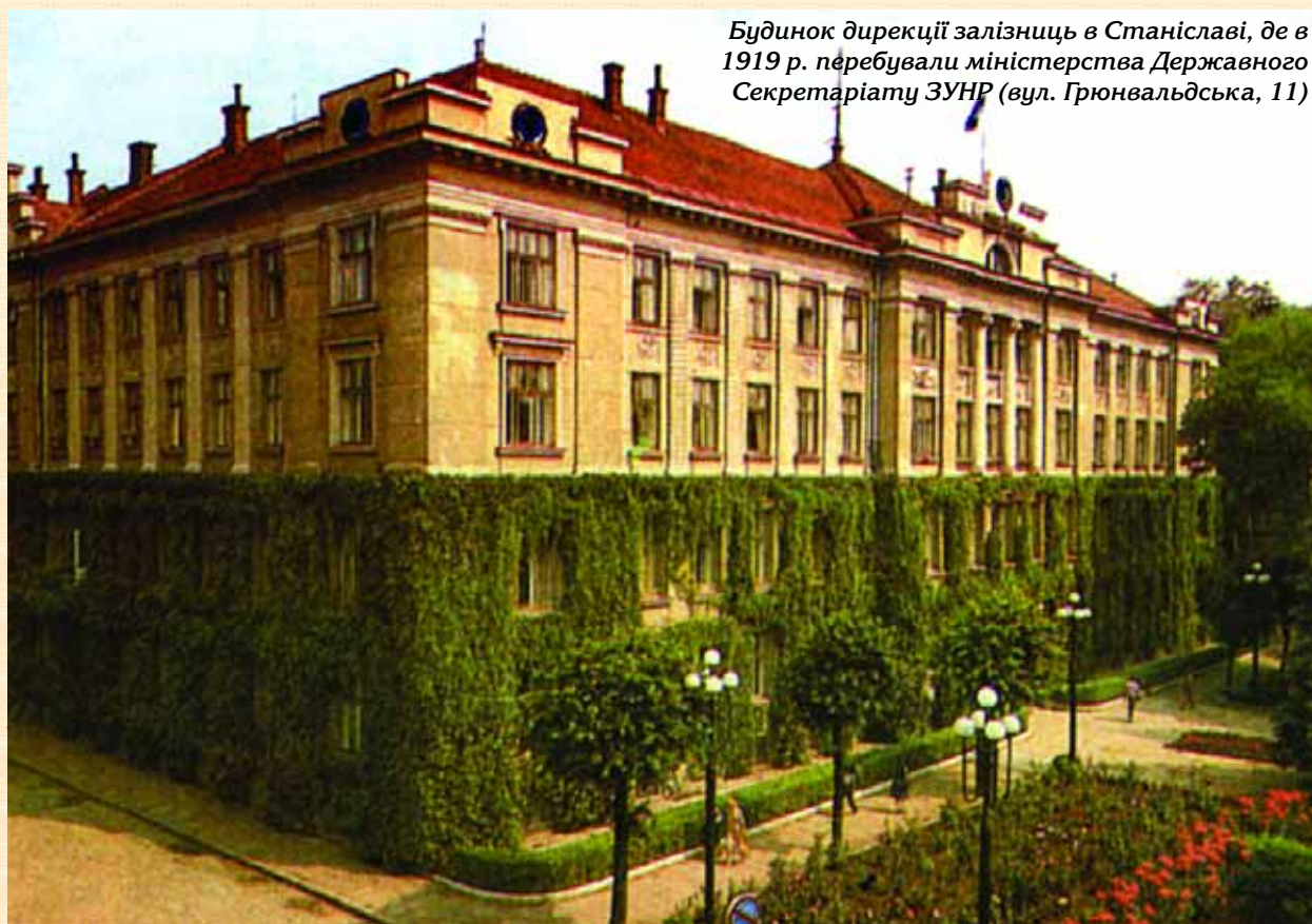
Будинок дирекції залізниць в Станіславі, де в 1919 р. перебували міністерства Державного Секретаріату ЗУНР (вул. Грюнвальдська, 11)

За останні роки на честь політичних, громадських діячів ЗУНР в Івано-Франківську (колишньому Станіславі — тимчасовій столиці держави у першій половині 1919 р.) — перейменовано цілу низку вулиць: Січових стрільців, Михайла Грушевського, Дмитра Вітовського, Симона Петлюри, Мирона Тарнавського, Євгена Петрушевича, Костя Левицького, Івана Мирона, Івана Макуха та ін.