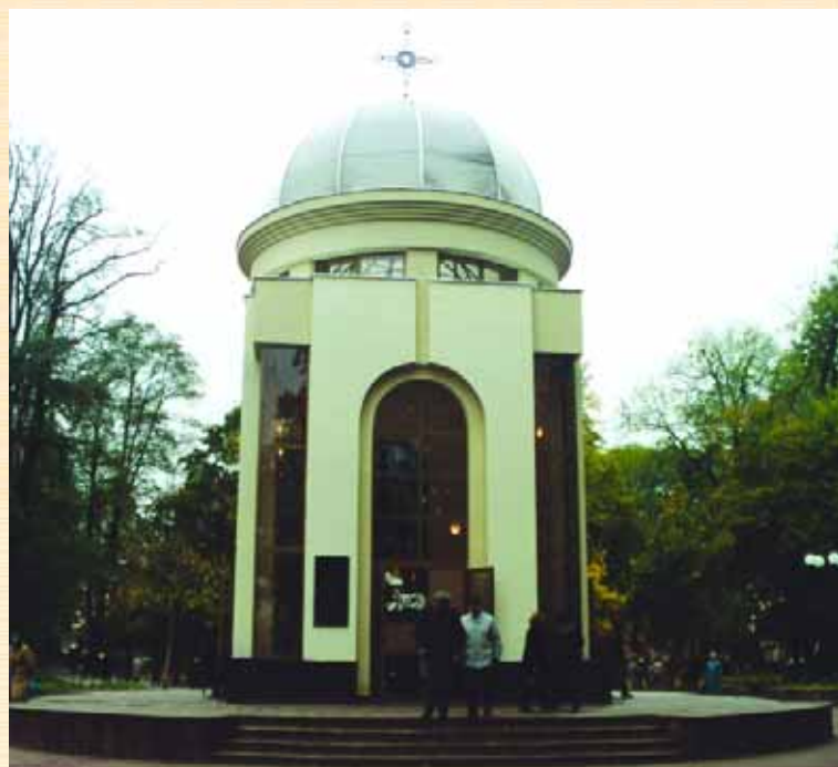
Каплиця в меморіальному сквері, м. Івано-Франківськ

подій, діячів ЗУНР, Української Галицької Армії (УГА), що загалом не відповідає стану увічнення подій того часу.