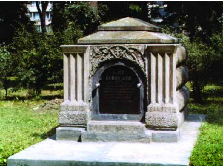
Могила Лева Бачинського у меморіальному сквері м. Івано-Франківська

1971 р. бульдозерами було зруйновано стрілецькі могили на Янівському цвинтарі у Львові. Дивом вціліли могили двох керівників національно-визвольних змагань: Командуючого УГА Мирона Тарнавського та першого президента Тимчасового Державного Секретаріату ЗУНР (уряду — Авт.) Костя Левицького. Нині меморіал провідників ЗУНР повністю відновлений і займає чільне місце в некрополі героїв визвольних змагань українського народу.