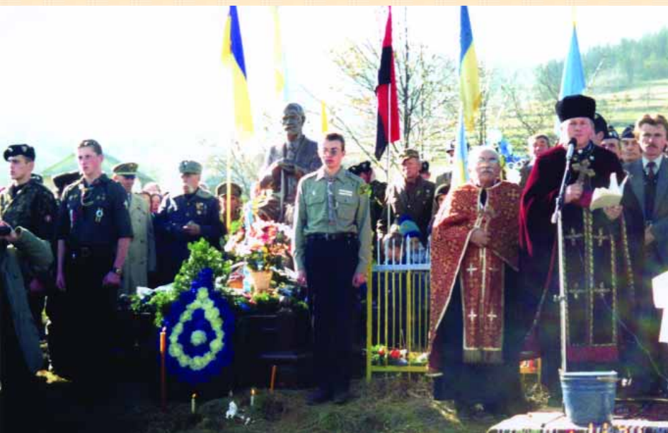
Пам'ятник на могилі міністра ЗУНР М. Мартинця в с. Луквиця Богородчанського р-ну

надмогильний пам'ятник Михайлові Мартинцю, міністрові земельних справ уряду ЗУНР, розстріляному 10 червня 1919 р. польськими окупантами у Небилівському лісі (Калуський повіт).