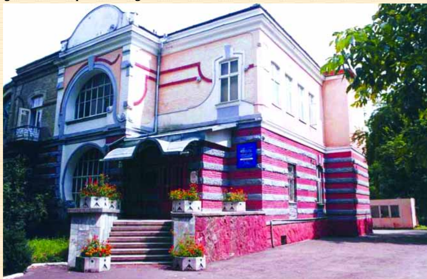
Музей визвольних змагань Прикарпатського краю у м. Івано-Франківську

Ще один пам'ятник, присвячений річниці ЗУНР, встановлено й урочисто освячено 1997 р. вже на Івано-Франківщині, в селі Луквиця Богородчанського району. Тут, на місцевому цвинтарі, було відкрито