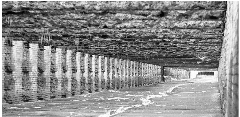
Стрілецький тир на Печерську всередині. 1969 р.