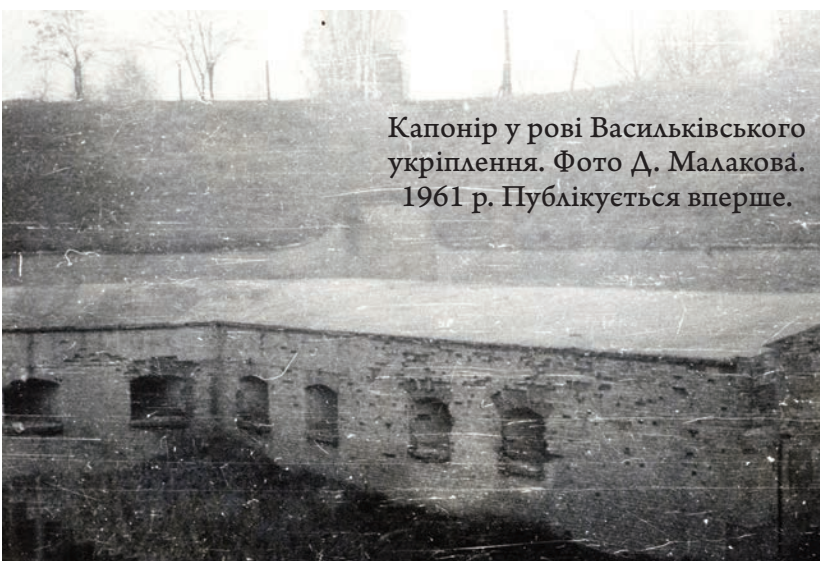
Капонір у рові Васильківського укріплення. 1961 р. Публікується вперше.