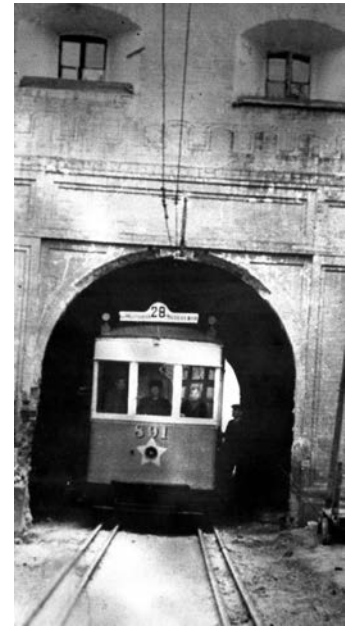
Подільські ворота з трамваем 28-го маршруту. Фото 1930-х рр.