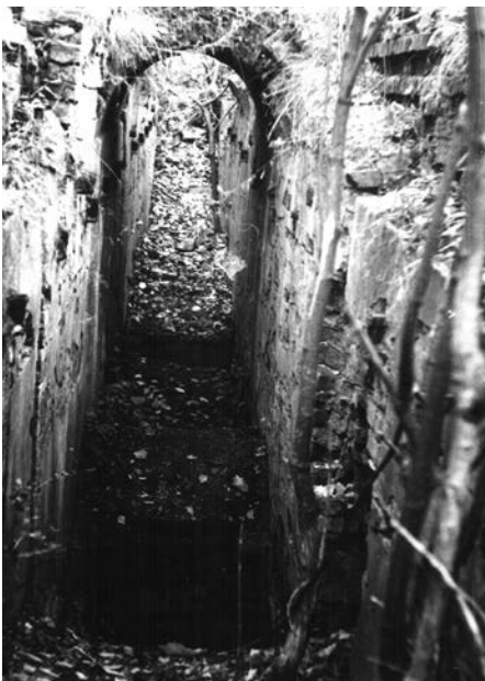
Рештки підвалин Набережного верку. 1969 р. Публікується вперше.