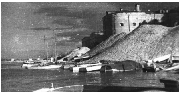
Човновий причал біля Подільських воріт. Фото 1950 р.

Цікавість до старовини рідного Києва прищепив мені старший брат, згодом – заслужений художник України Георгій Васильович Малаков (1928-1979). Навчаючись у повоєнні роки в Київській художній середній школі ім. Т. Г. Шевченка, він брав мене (тоді ще учня молодших класів звичайної школи) з собою «на етюди». То були улюблені місця його довоєнного дитинства: Хрещатик, Липки, Лавра, Аскольдова могила, схили Дніпра. Одного разу ми побували поблизу нижнього підпірного муру Київської фортеці. Обравши мальовничий куточок, брат вмостився писати етюд. Поки він працював, я гасав по схилах, лазив на дерева, розважаючись відповідно до віку. Пригрівало сонечко, пурхали метелики, у високій траві тріщали коники... Коли брат закінчив роботу, ми зійшли нижче, в затінок високих дерев. Там відкрився в усій суворій величі цегляний мур, увігнутий дугою, наче гребля Дніпрогесу. Зверху, під потрощеним карнизом тягнулась вервечка декоративних стрільниць, а знизу, забігаючи на круті схили яру, чорніли отвори справжніх рушничних бійниць обабіч двох широких артилерійських амбразур. Подекуди під ногами валялись важкі жовті цеглини з клеймами – з літерами й цифрами. Ми зайшли всередину через стрільчасті готичні двері, сторожко озирнулися. Круті цегляні сходи та склепінчасті стелі, таємничий холодний морок у глибині підземелля нагадували се-