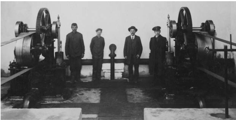
Машинний зал Подільської помпової станції (1894 р.)

Архів зберіг для нащадків «Особое мнение Председателя канализационной комиссии барона М.В. Штейнгеля» 1 , який багато зробив у справі каналізації Києва. Штейнгель наполягав, щоб оплату за користування каналізацією слід увести з 1894 року, а не з 1896 року як передбачалося міською Думою [4, 5].