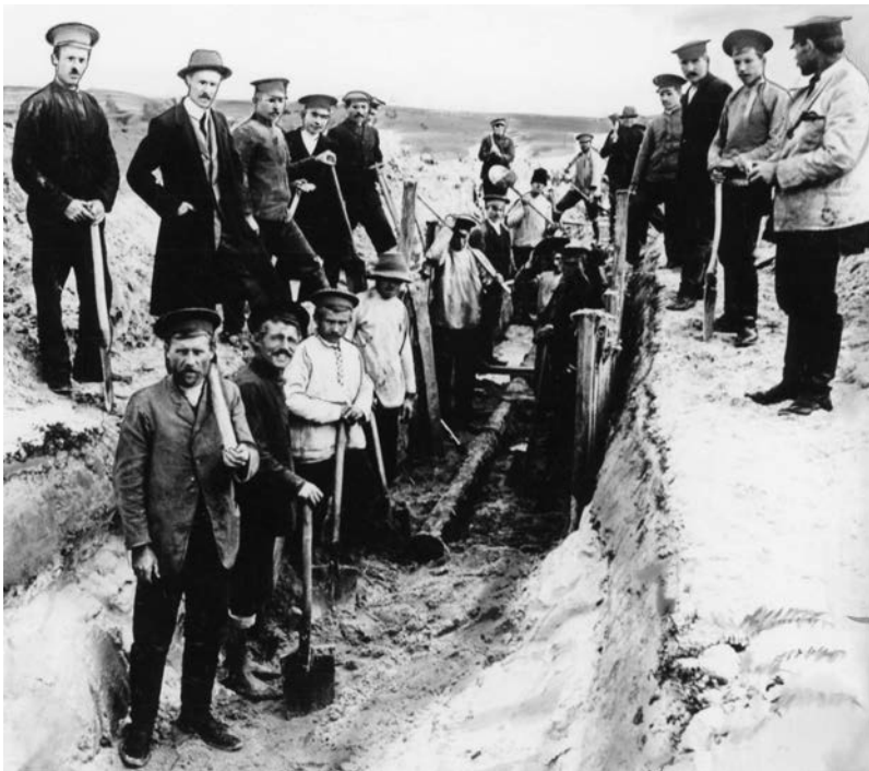
Прокладання мулопроводу від відстійників під Лисою горою до полів зневоднення