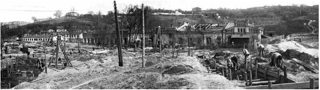
Прокладання каналізаційного колектора в районі Троїцької площі (нині – НСК «Олімпійський»)

Важливу інформацію з історії побудови каналізації містять листи Голови правління Київського товариства каналізації лікаря Є. І. Афанасьєва до Київської міської управи від 24 квітня 1894 р. [6, 7, 8]