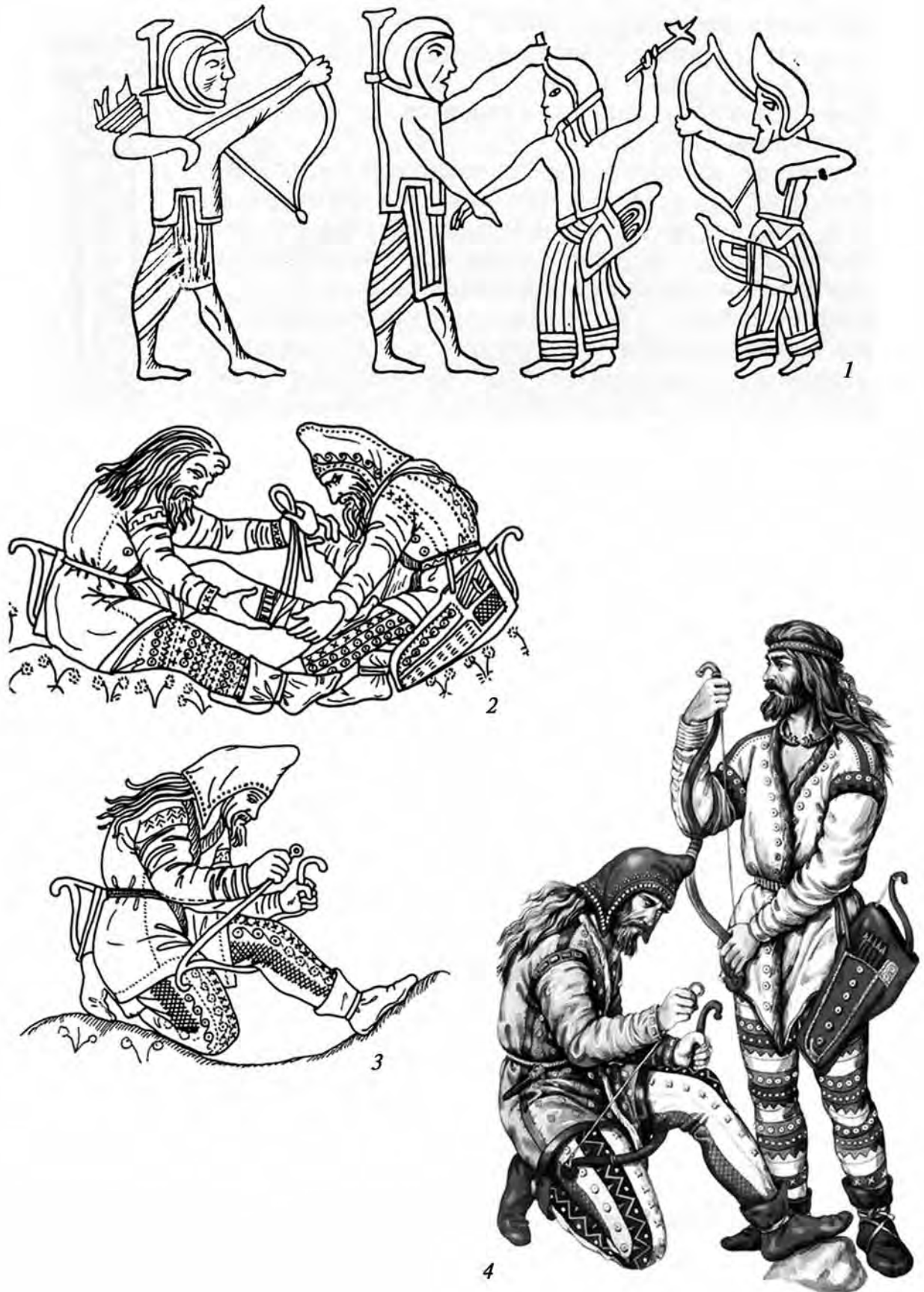
Рис.2. Образи чоловіків у головних уборах – кірбасіях.

1 – зображення скіфів на циліндричній печатці (рубіж VI–V ст. до н.е.); 2, 3 – образи скіфів на вазі з кургану Куль-Оба (IV ст. до н.е.); 4 – реконструкція скіфських костюмів за образотворчими пам'ятками (художник З.О.Васіна).