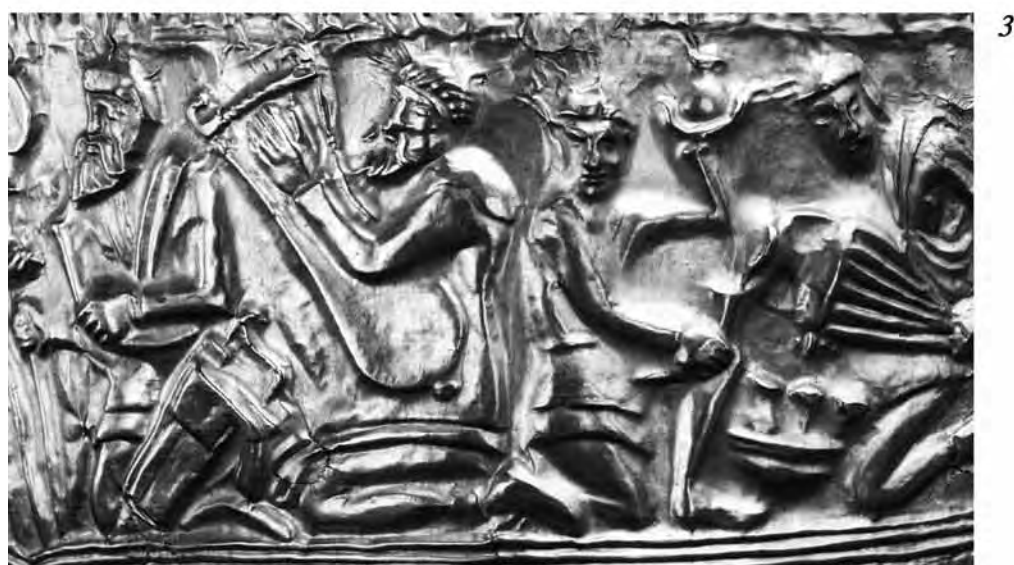
Рис.3. Образи скіфів на пам'ятках IV ст. до н.е.

1 – пластинка зі знахідок у кургані № 5 поблизу с.Аксютинці (Сумська обл.); 2, 3 – зображення скіфів на пластині «Гезе» – з кургану поблизу с.Сахнівка (Черкаська обл.).