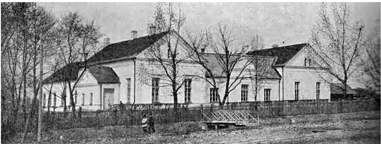
Лікарня у м. Шпиків (фото поч. ХХ ст.)

Розпорядок робочого дня у Шпиківському маєтку на початку ХХ ст. виглядав наступним