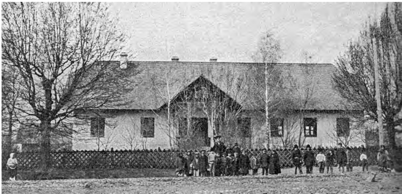
Школа у м. Шпиків (фото поч. XX ст.)

чином: початок роботи в 6.00 год.; сніданок в період з 8 до 9.30 год. (тривалість не більше 30 хв.); обід для робітників з худобою з 12.00 до 14.00 год., для інших – з 12.00 до 13.00 год.; завершення роботи із заходом сонця. Раціон влітку під час збирання зернових був таким: на обід «кондер» – рідкий суп з пшона та ячмінної крупи з салом; по завершенню роботи ввечері – зазвичай знову «кондер» [3, с. 60].