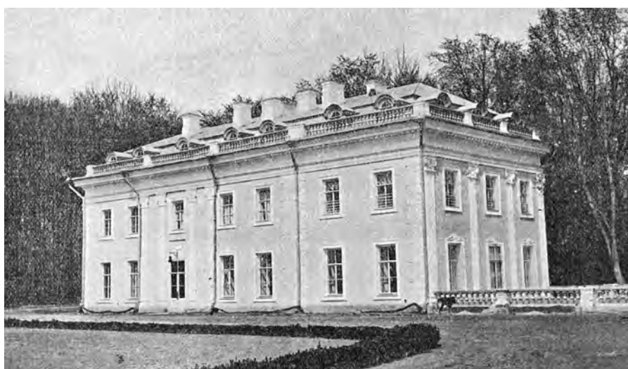
В'їзд до панської садиби (фото поч. XX ст.)