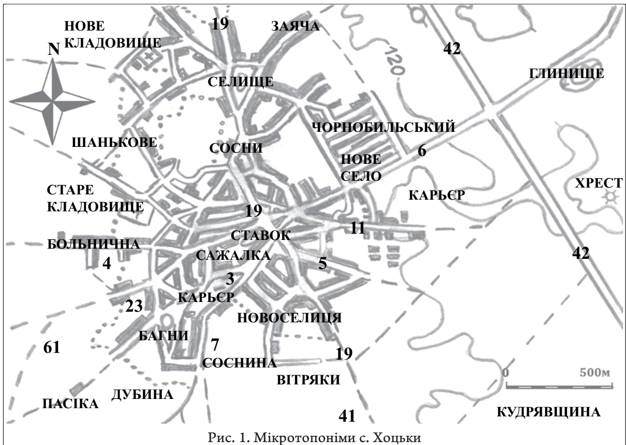
Рис. 1. Мікротопоніми с. Хоцьки

11. Колгоспна дорога або Хрестова – дорога ХІХ ст. – середини ХХ ст. Назва Хрестова походить від напрямку руху повз курган з хрестом. З другої половини ХХ ст. розповсюджується назва Колгоспна. Бере свій початок у центрі біля Ставка і закінчується в будівлях колишнього колгоспу. У межах села понад 1,5 км.