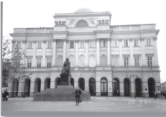
Варшава, палац Сташіка, вул. Новий Світ, № 72. У цьому будинку міститься Інститут літературних досліджень Польської академії наук. На передньому плані пам'ятник Н. Копернику.