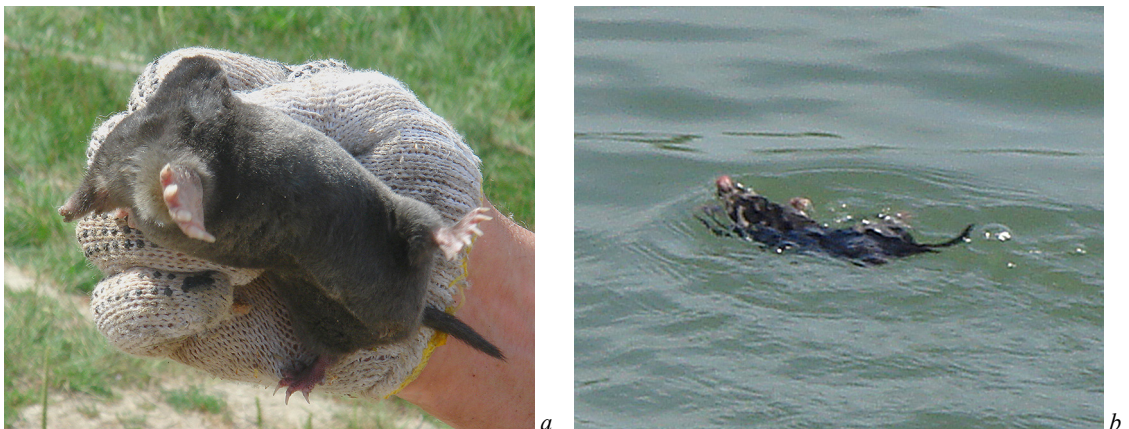
Рис. 2. Кріт, що здійснював міграцію через р. Дністер в районі 50 км траси Одеса–Рені у липні 2008 р.: a — кріт європейський крупним планом, b — особина під час міграції.

Третя знахідка (рис. 1 b , точка 3) — заплавний ліс в районі «50 км» траси Одеса–Рені. Тут у липні 2008 р. у час повені автори спостерігали активну міграцію різних видів ссавців через р. Дністер на суходільні ділянки. Серед них був і кріт (рис. 1 b , точка 2). Кріт рухався у напрямку заплавного лісу, в якому були різноманітні узвишся, дамби та острівці, на яких він міг знайти прихисток від повені.