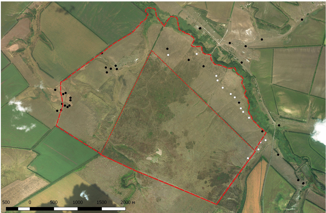
Рис. 4. Територія заповідника з осередками бабака на травень 2018 року (світлим кольором показані сімейні родини, що зникли протягом останніх 5 років).

Особливо катастрофічним зниження відбулося протягом останніх трьох років (2016–2018). Із 20 сімей, що проживали в долині р. Черпаха, на травень 2018 р. залишилося лише 4, і в них проживає лише по 1–2 особини. Без втручання людини ці родини також зникнуть. Всього на території заповідника збереглися до 20 родин, які сконцентровані на периферії, трьома осередками (рис. 4). В таблиці 1 наведено координати цих поселень.