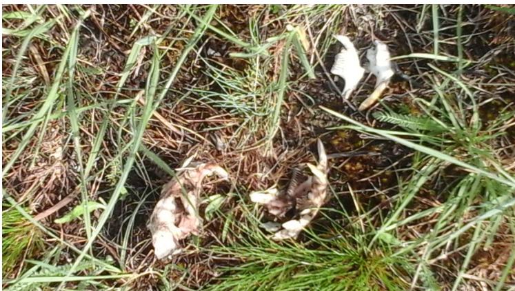
Рис. 5. Біля гнізді круків на високовольтній лінії біля сім'ї бабаків № 3 знайшли рештки двох черепів бабачат.

Якщо тенденції погіршення умов проживання бабака збережуться, то за відсутності пресу хижаків продовжить змінюватися і віковий склад сімей. Прибулих не буде або смертність у виводках становитиме 100 %. Така ситуація характерна для всієї старої території заповідника Стрільцівський степ, і падіння чисельності внаслідок старіння популяції носить катастрофічний характер. Протягом 1–2 років бабак зникає на площі сотень гектарів (Боровик, 2006). За участю великих хижаків або браконьєрства процес йде швидше (Боровик, 2014). Найбільш істотний вплив на популяцію бабака роблять свійські пси, а також вовки і лиси. Особливо цей вплив відчувається при фрагментації ареалу бабака та його поселень.