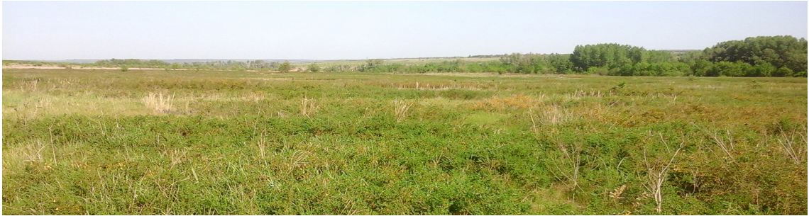
Рис. 1. Сучасний вигляд рослинного покриву: на передньому плані зарості карагани.