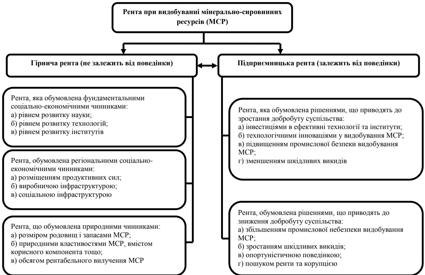
Рис. 2. Економічний прибуток (рента) при видобуванні мінерально-сировинних ресурсів

Причини утворення ренти та її види неможливо розділити за об'єктивними критеріями, але за допомогою експертних обґрунтувань і оцінок спільно з конкретним надкористувачем можна визначити, яка частина ренти є гірничою незалежною від рішень і поведінки господарюючих суб'єктів, а яка – підприємницькою, тобто залежною від їх рішень та поведінки. Це дуже важливо з метою економічного обґрунтованого оподаткування, оскільки тільки податок, що справлятиме в господарюючих суб'єктів гірничу ренту, може сприйматись господарюючими суб'єктами-надкористувачами та власниками мінерально-сировинних ресурсів у надрах як неспотворений та справедливий (рис. 2).