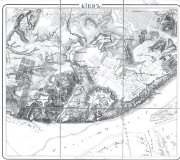
Рис. 2. План фортеці станом на 1854 р.

Нова фортеця півкільцем охоплювала майже всю Печерську височину між Кловським ярмом на півночі, Наводницьким ярмом на півдні, схилами Черепанової гори та долиною р. Либідь на заході, впираючись флангами в береги річки Дніпро.