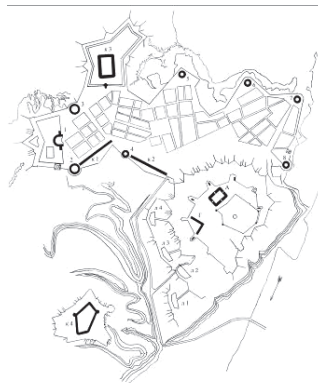
Рис. 1. Первинний план будівництва фортеці (1830 р.)

25 березня 1830 року Миколою I був затверджений Генеральний план будівництва нової фортеці. Автором первісного проекту був інженер-генерал Карл Іванович Опперман. Розбивка фортеці на місцевості відбулась в присутності імператора 31 травня того ж року. А вже 30 липня 1831 року був закладений перший камінь у фундамент Редоїту № 1 Васильківського укріплення – який став першою спорудою Нової Печерської фортеці. Згідно формуляру Київської фортеці, будівництво Васильківського укріплення розпочато в 1832 році і закінчено у 1839, за виключенням Башти №3, яку закінчили тільки у 1842 році.