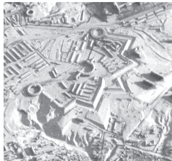
Рис. 4. Німецький аерознімок 1944 р., на якому добре видно загальний стан укріплення, ерозійний процес на правому фланзі та відсутність у Башти № 2 даху.

На початку 20 ст. була розібрана ескарпова стіна, відкритий артилерійський каземат з потерною на правому фланзі, частина горжової стіни між Баштою №3 та Редюїтом, трохи пізніше капонір. Продовжились значні ерозивні процеси західного яру, що призвели до обвалу гласису на цій ділянці майже до Башти № 3. В середині 40-х років Башта була вже на краю урвища, а зсув почав підготувати головний вал. Все це добре видно на аерофотознімках та картах 30 – 40 років.