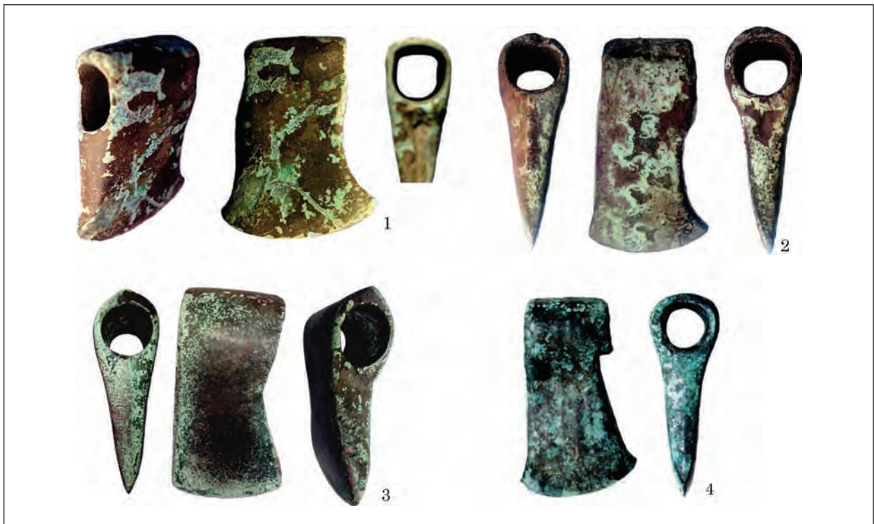
Рис. 7. Варіант «сокири лісорубів»: 1 — Чернігівщина; 2, 3 — Харківська обл.; 4 — Станятин, повіт Томашів Любелський, Польща

2), у Тернопільській обл. (Віоліті, 16.09.2016), м. Київ (Віоліті, 27.11.2016), Черкаській обл. (Віоліті, 27.08.2018) (рис. 4: 1—10). Сокири, знайдені біля с. Ксаверово Городищенського р-ну Черкаської обл. (Колекція А. В. Козименка, надходження 2018 р., аналіз 1783) (рис. 3: 11) та з селища Дібровка Золотоношського р-ну Черкаської обл. (Колекція А. В. Козименка, надходження 2018 р., аналіз 1782) (рис. 4: 12) виготовлені з миш'якової бронзи (рис. 9).