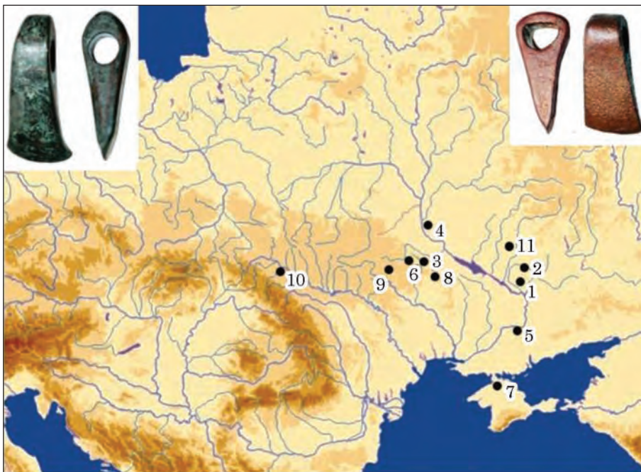
Рис. 2. Мапа сокир самарського типу

матриці, розташовану з «внутрішнього» боку сокири — техніка лиття у відкрите «черевце» (рис. 1: 1, 2).