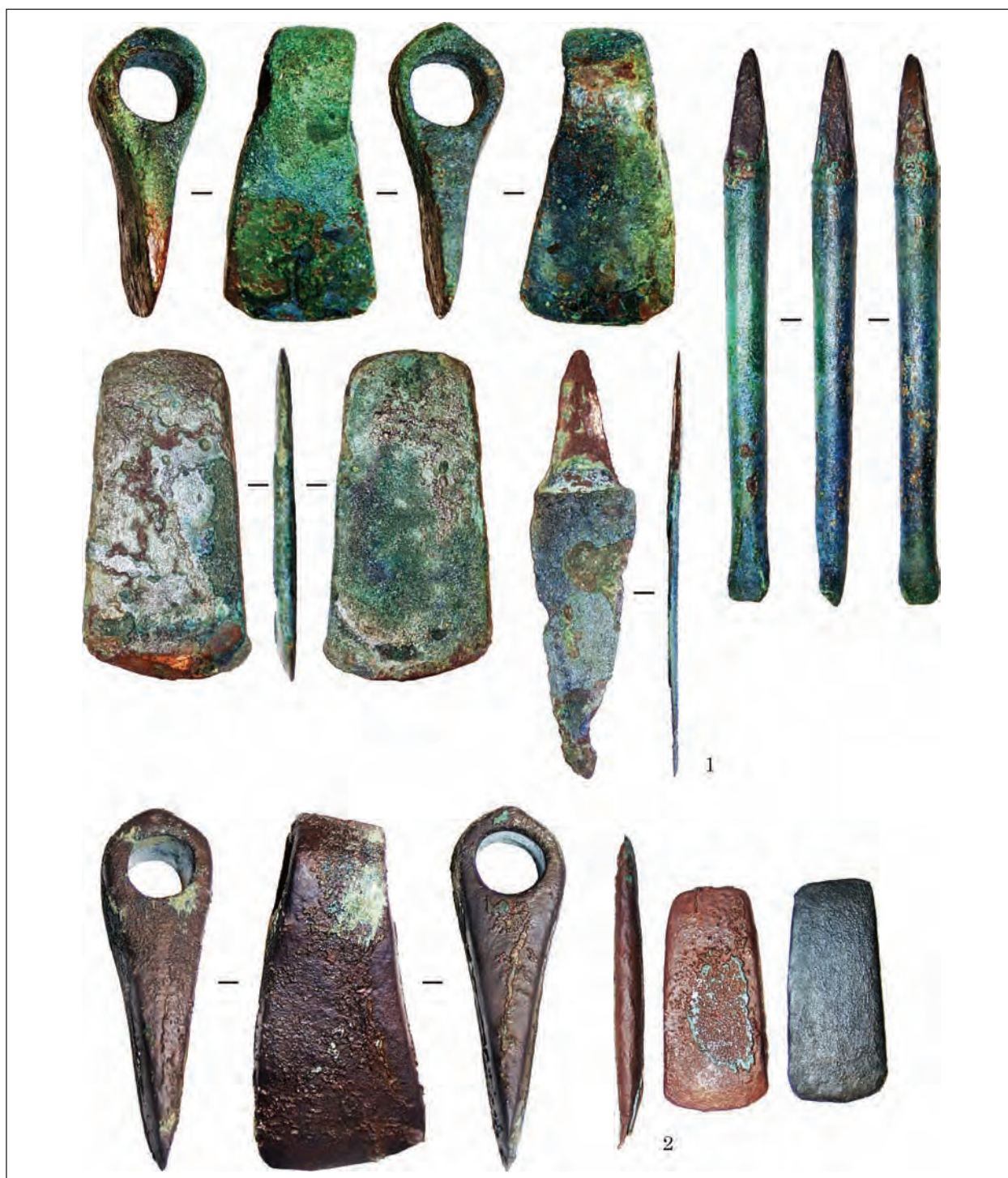
Рис. 8. Варіант «сокири теслярів»: 1 — Красноперекопськ; 2 — Івонівський скарб

2017, 2.1.1, аналіз 1826) (рис. 6: 3), біля смт Макарів Київської обл. (Віоліті, 26.12.2016), села Чапаївка Золотоніського р-ну Черкаської обл. (Клочко 2006, рис. 25: 3), на «Київщині» (Клочко 2006, рис. 25: 1), біля с. Гришинці Канівського р-ну Черкаської обл. (Клочко 2006, рис. 25: 4) (рис. 5: 4—7), біля с. Смільчинці Лисянського р-ну Черкаської обл. (Клочко, Козыменко 2017, 1.3.3, аналіз 1695) (рис. 5: 8), біля с. Вишківці, Немирівського р-ну Вінницької обл. (колекція А. В. Козыменка, надходження 2018 р., виго-