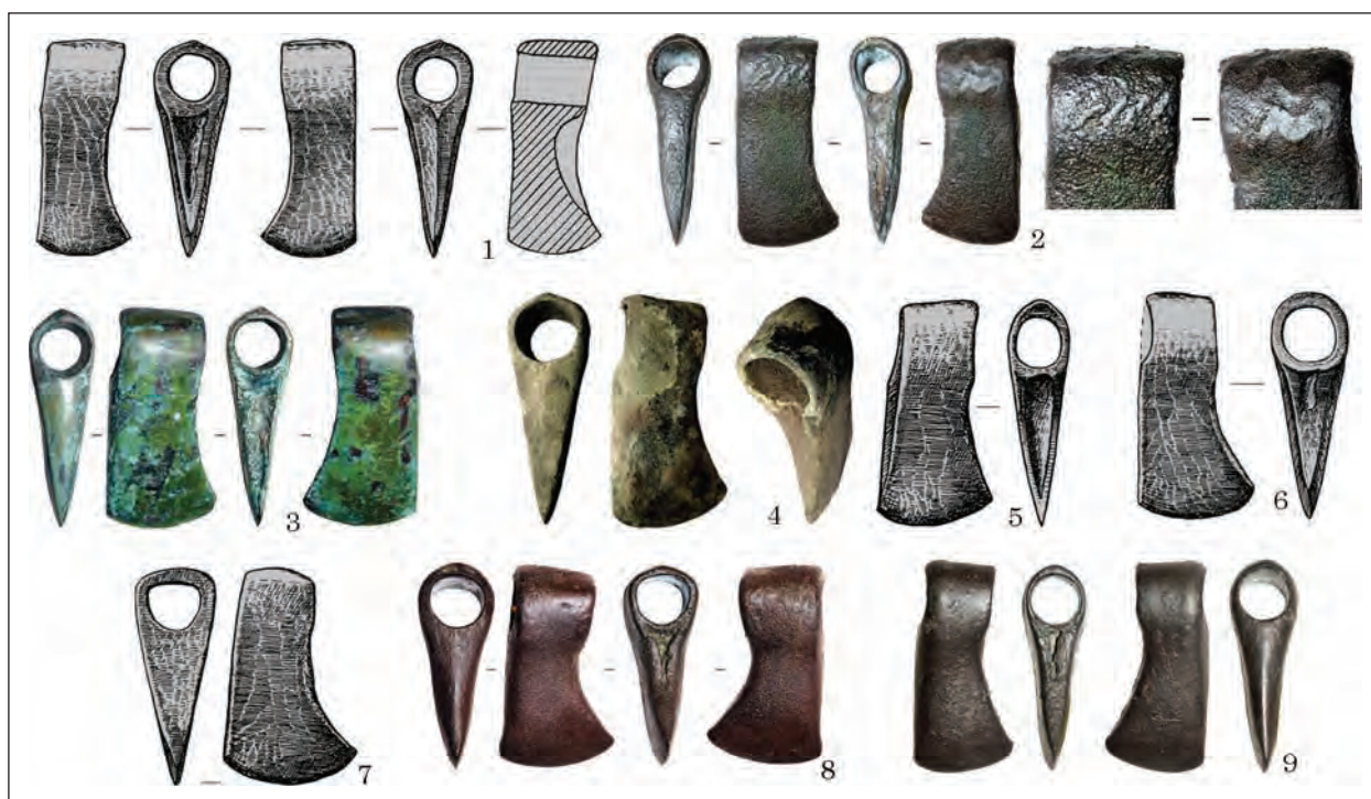
Рис. 5. Варіант Підлісся: 1 — Підлісся; 2 — Світловодськ; 3 — Кедина Гора; 4 — Макарів; 5 — Чапаївка; 6 — «Київщина»; 7 — Грищинці; 8 — Смільчинці; 9 — Вишківці

Полтавській обл. (Віоліті, 24.06.2016), у Сумській обл. (Віоліті, 09.04.2017), біля м. Черкаси (Віоліті, 21.04.2017), біля с. Стайки Кагар-