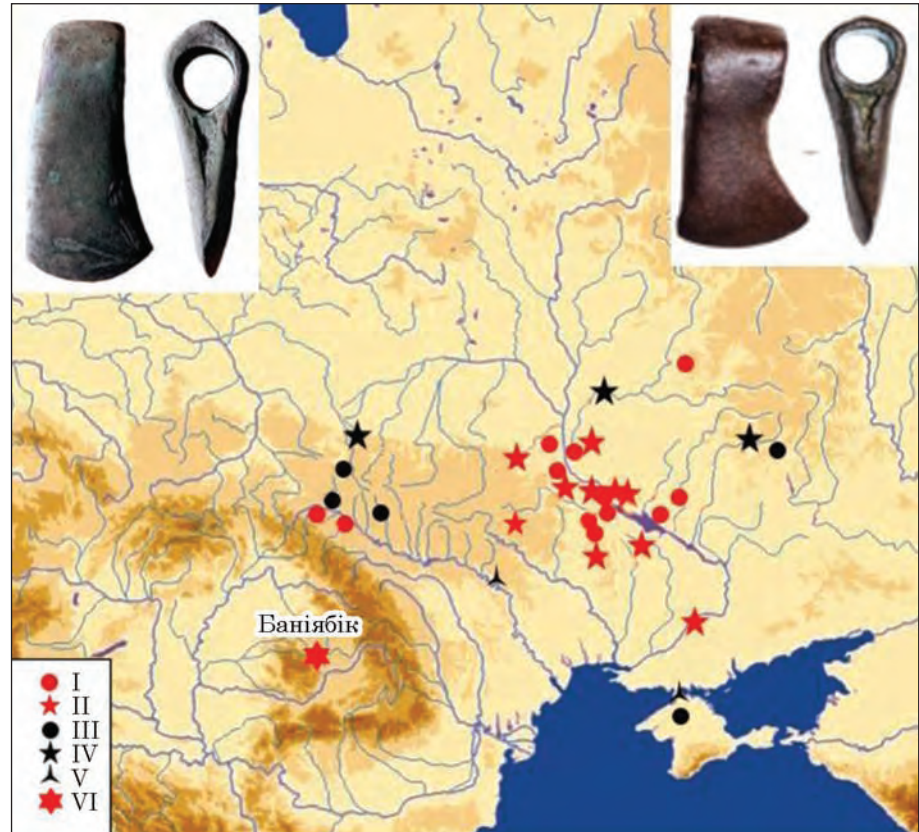
Рис. 9. Мапа сокир типу Баніябик: I — варіант Гречаники; II — варіант Підлісся; III — варіант Рудня Мала—Маліївці; IV — варіант «сокири лісорубів»; V — варіант «сокири теслярів»; VI — скарб Баніябик

с. Рудня Мала Жешовського воєводства Польщі (Клочко 2006, рис. 50: 1), с. Маліївці Дунаєвського р-ну Хмельницької обл. (Клочко, Ко-