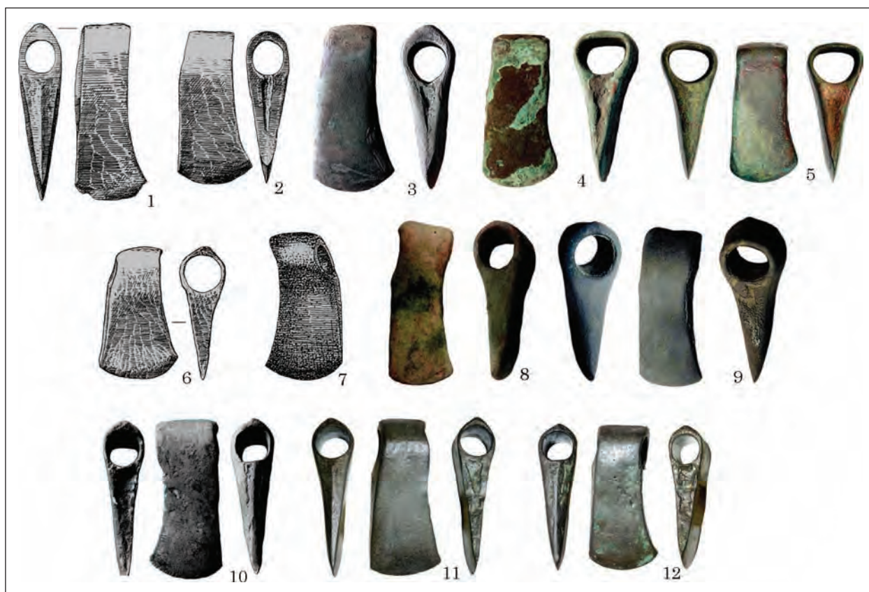
Рис. 4. Варіант Гречаники: 1 — Гречаники; 2 — Гнідин; 3 — Полтавська обл.; 4 — Сумська обл.; 5 — Черкаси; 6 — Стайки; 7 — Пістинь; 8 — Тернопільська обл.; 9 — Київ; 10 — Черкаська обл.