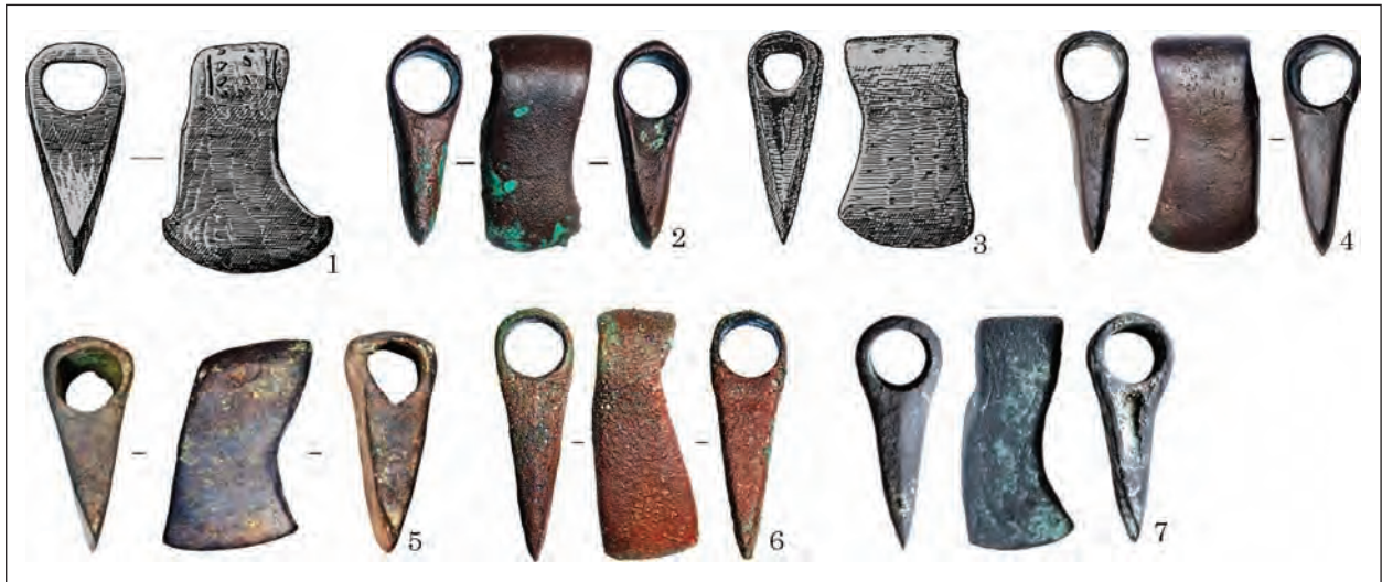
Рис. 6. Варіант Рудня Мала — Маліївці: 1 — НМІУ; 2 — Терехівський р-н; 3 — Рудня Мала; 4 — Маліївці; 5 — Степовий Крим; 6 — Вороновиця; 7 — Харків