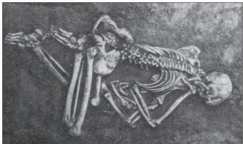
Рис. 2. Матеріали поховань: 1 — с. Політотдельське, уроч. Ямки, кург. 3, пох. 8 (за Синицын 1960)

Узагальнюючи спостереження варто зазначити, що специфічною для поховань чорногорівсь-