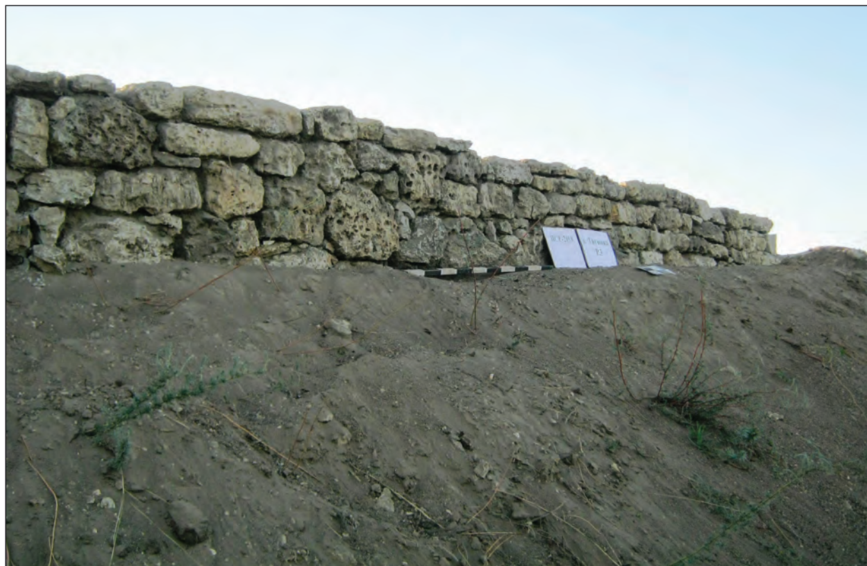
Рис. 6. Фрагмент зовнішньої стіни фортеці Тягин