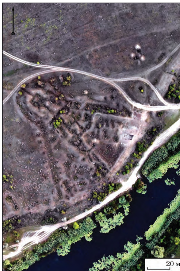
Рис. 5. План фортеці Тягин (за результатами досліджень 2018 р.)

Інтерпретація. За площею та плануванням Литовська фортеця князя Вітовта належить до невеликих оборонних споруд, відомих в різних частинах Європи: від Балтії до Балкан. У тому числі у Молдові, Греції Малої Азії. За планом (рівнобедрений трикутник) її можна зарахувати до фортець константинопольського типу, характерних для усїєї європейської території ще у XIII—XIV ст. Якщо екстраполювати на Литву, саме таке планування характерне для Неменчинського замку (Виткунас, Забела 2017, с. 69), багатьох фортець Молдови та Північного Причорномор'я (Білгород-Дністровська фортеця).