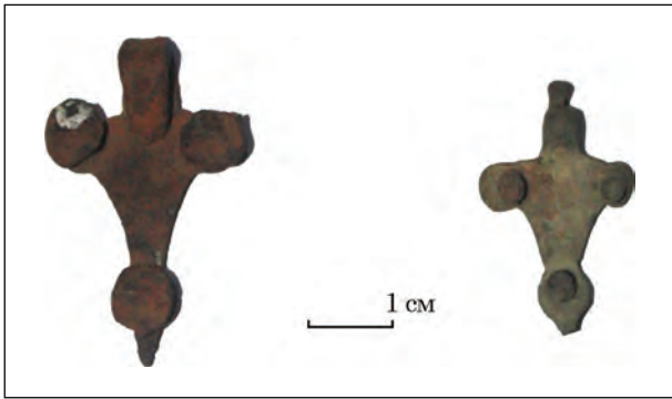
Рис. 4. Накладки на гаманці: 1 — бронзова; 2 — залізна

належність до кола литовських старожитностей. Але близькі за формою браслети відомі і у східнослов'янських землях. У типологічній класифікації Г. О. Федорова-Давидова браслет такої форми виділений у тип IV, який не набув масового поширення серед кочовиків (Федоров-Давыдов 1966, с. 41). Поруч із браслетом знайдено дві монети. Перша — срібна татарська монета із тамгою у центрі — дирхем другої—третьої чверті XV ст. Друга монета виготовлена з білону. Це польський денарій Владислава Варненчика (1434—1444 рр.), Краків. На тому самому розкопі знайдені ще дві монети. Перша монета золотоординська, срібна, дирхем, Кичи-Мухаммед (1430—1444 рр.). У центрі джучидська тамга, місце карбування Орда-Базар, розташування якої точно не відомо, але одна з поширених версій — Нижнє Подніпров'я. Друга монета бронзова поганої збереженості, швидше за все також татарського походження.