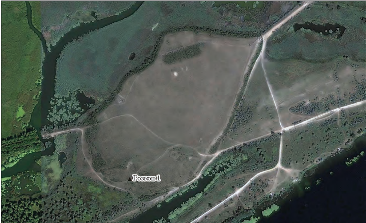
Рис. 1. Розташування розкопів 2016—2017 рр. на території городища

зуміючи значення пам'ятки, сподівався на продовження досліджень. На жаль, він так і зміг реалізувати власні плани, але результати робіт відкрили можливості первинного аналізу унікального об'єкту Півдня.