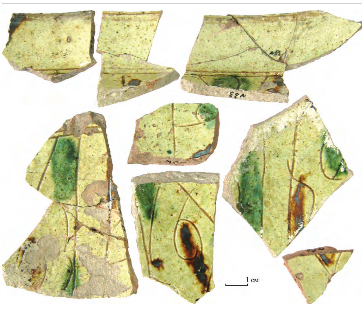
Рис. 3. Фрагменти кераміки сграфіто

Найбільша кількість артефактів традиційно належить керамічним виробам, серед яких слід відмітити тарний, кухонний та столовий посуд, зокрема з ангобом та поливою зеленого та брунатного кольору. Особливо слід відмітити посуд відкритих форм (чаші -миски) сграфіто кінця XIV — XV ст. (рис. 3), аналогії яким є в Очакові так Білгороді-Дністровськом, а також серед кераміки групи Південно-Східний Крим (Біляєва 2012, с. 193, 182; Тесленко 2018, с. 63). Аналогії подібним зразкам кераміки сграфіто зустрічаються у шарах XIV—XV ст. Північного Причорномор'я (Білгород-Дністровський, Очаків, Дніпровка II та ін.). Серед металевих виробів (з заліза, чавуну та бронзи) є серп, аналогічний знахідці В. І. Гошкевича. Є також цвяхи різного призначення, вістря черешкової чотиригранної стріли, кресало, фрагменти чавунних казанів. Поблизу розкопу знайдена залізна каблучка із овальним щитком та зображенням «вершника» (?), а також пошкоджена бронзова монета, яка за визначенням Г. О. Козубовського швидше за все, є татарською і датується кінцем XIV — XV ст.