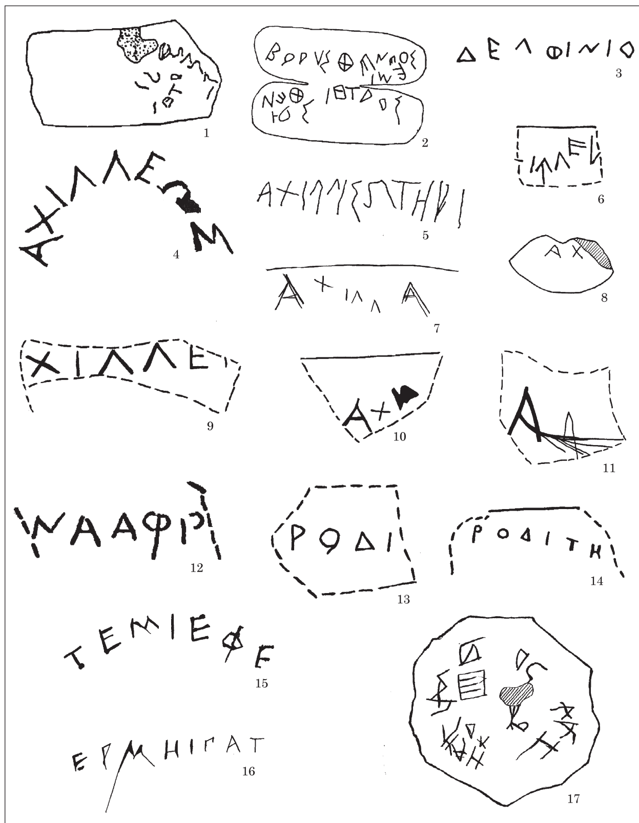
Рис. 1. Сакральні графіті з розкопу В. В. Лапіна в Борисфені: 1 — Аполлону Іетросу; 2 — графіті на кістяній пластинці; 3 — Дельфінія (власність); 4 — Ахілла (власність); 5 — Ахіллу Сотеру; 6, 9—11 — Ахіллу (фрагменти присвят); 7, 8 — Ахіллу або Ахілла (власність); 12—14 — фрагментовані присвяти Афродіті; 15 — фрагментована присвята Артеміді Ефеській; 16 — фрагмент присвяти Гермесу Патроу; 17 — вотивний остракон з графіті

могли використовуватись у святилищах під час проведення певних ритуалів, зокрема, узливань вином на вівтарі.