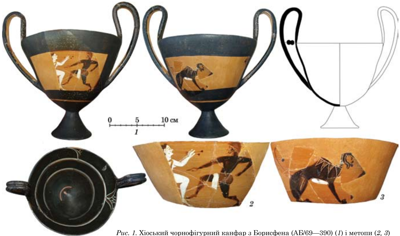
Рис. 1. Хіоський чорнофігурний канфар з Борисфена (АВ/69—390) (1) і метопи (2, 3)