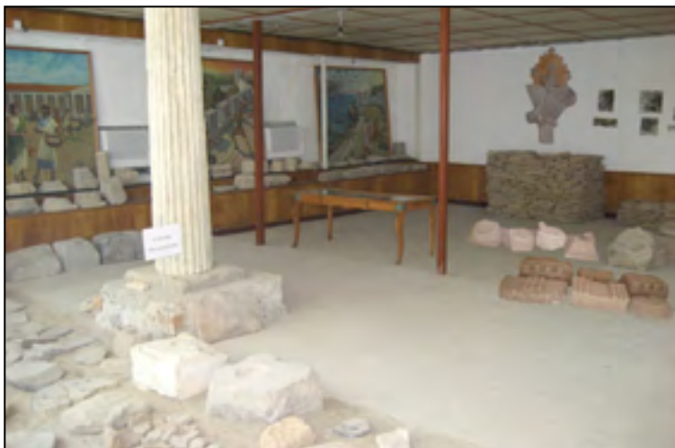
Рис. 5. Експозиція в закритому приміщенні