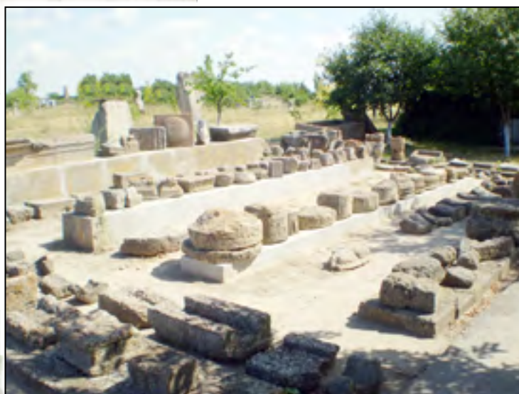
Рис. 2. Відкритий майданчик №1