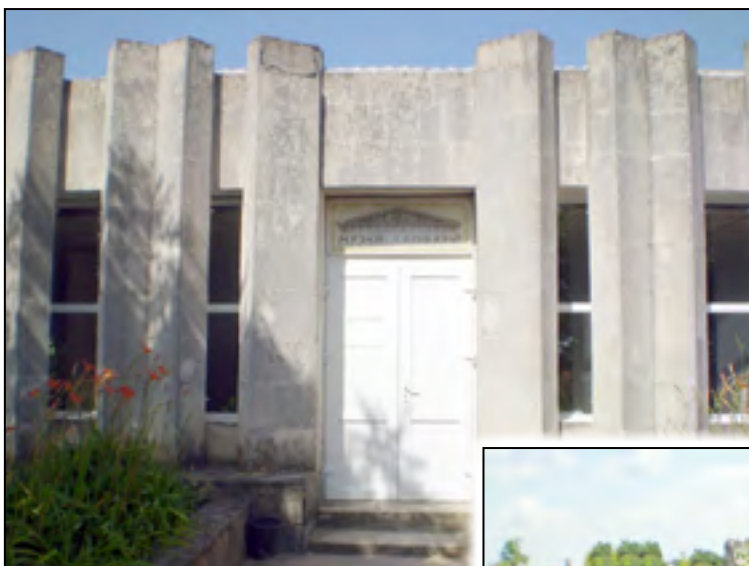
Рис. 1. Приміщення музею-Лапідарія