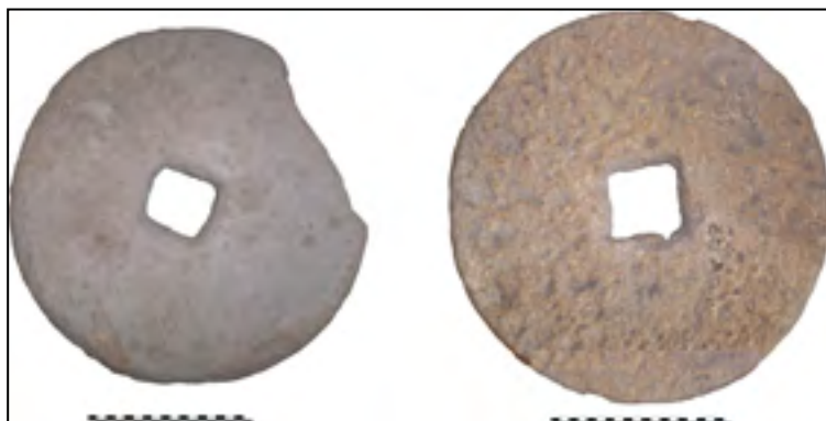
Рис. 6. Диски-маховики ножних гончарних кругів