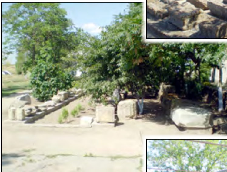
Рис. 3. Відкритий майданчик №2