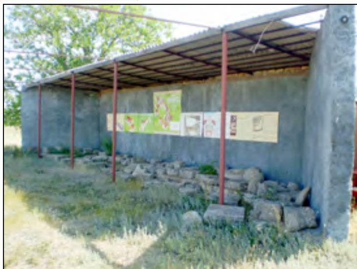
Рис. 4. Відкритий майданчик №3