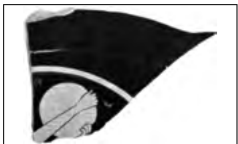
Рис. 9. Фрагмент червонофігурного кіліка із зображенням рук дискобола з диском