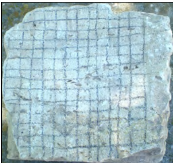
Рис. 10. Фрагмент гральної дошки