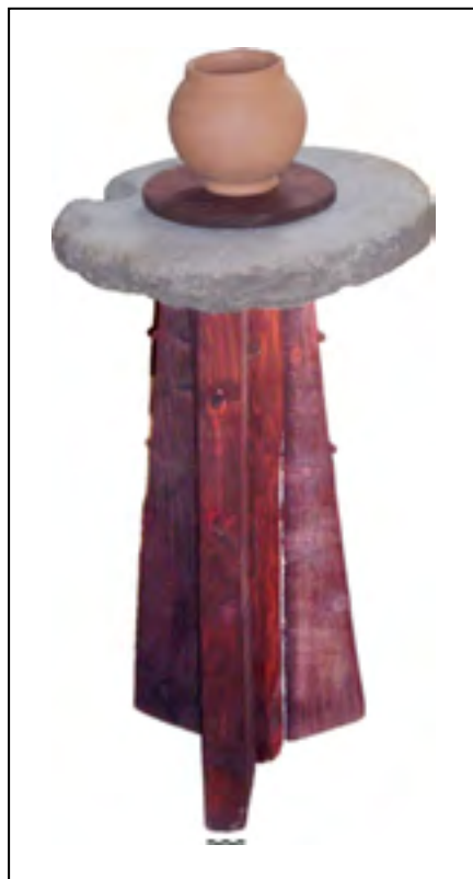
Рис. 7. Ручний гончарний круг (реконструкція)