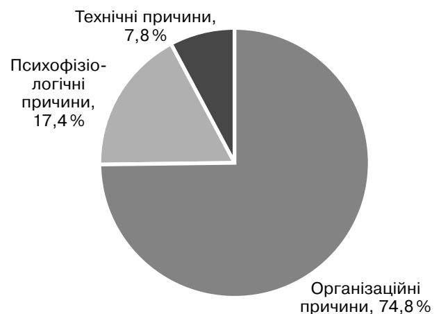
Рис. 3. Діаграма розподілу нещасних випадків за причинами виникнення у 2017 р. у Дніпропетровській області

Найчастіше траплялися психофізіологічні причини травматизму: особиста необережність потерпілого — 13,2% від загальної кількості травмованих