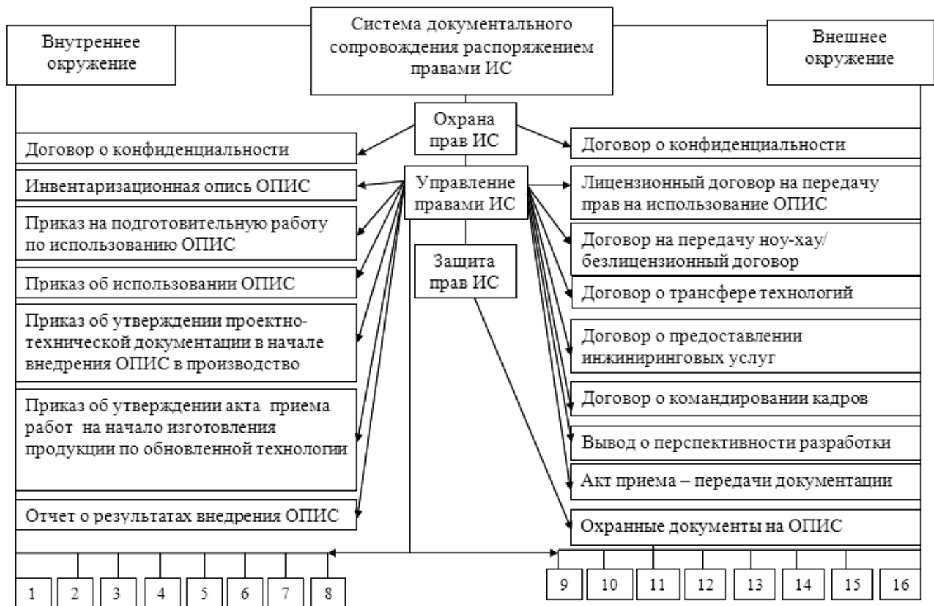
Рис. 1. Модель системы документального сопровождения распоряжением правами интеллектуальной собственности в условиях металлургического предприятия

Для достижения оптимального результата в работе с документами относительно распоряжения правами интеллектуальной собственности на металлургическом предприятии, необходимо разработать автоматизированную систему документации. Важной составляющей этой системы должна быть простота настройки та обслуживания системы, то есть простые и интуитивно понятные интерфейсы наладки сформированных потоков документов. Разрабатывая систему управления электронным документооборотом, специалист должен стремиться сделать простыми и понятными все инструменты, которые предназначены как для работы относительно пользования системой, так и для административной работы. Это позволит работать с ней не только специалисту, который отвечает за документацию по распоряжению правами интеллектуальной собственности на металлургическом предприятии, но и руководителям всех звеньев производства, а также генеральному директору предприятия. Система позволит увидеть недостатки в потоке документов, проверить правильность их оформления, увидеть дальнейшие шаги относительно развития производственных процессов и изготовления обновленной продукции на металлургическом предприятии.