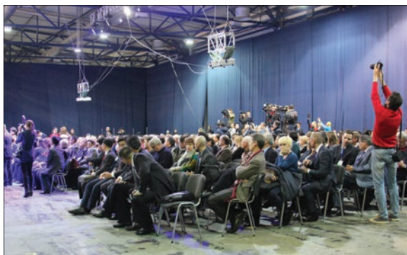
Во время церемонии открытия инновационного форума