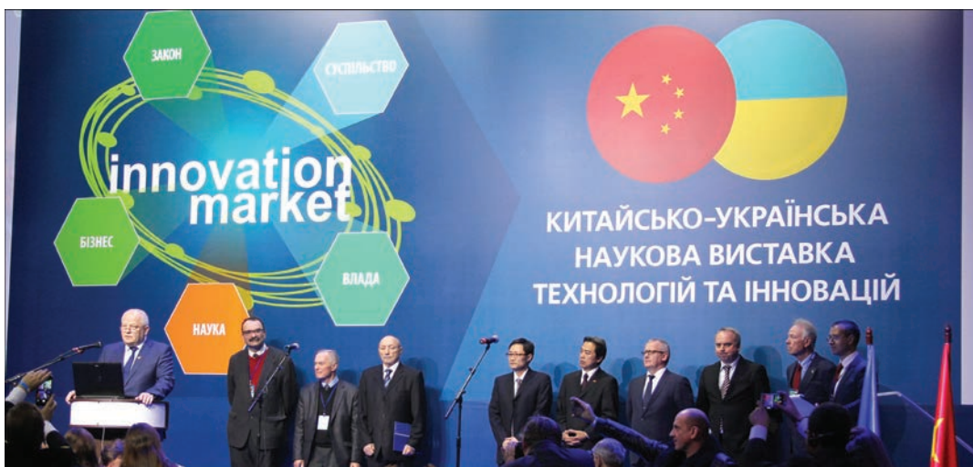
Выступление первого вице-премьер-министра Украины С. И. Кубива

Помимо работы основных экспозиций форума на протяжении трех дней проходили научно-технические конференции, семинары и презентации. Особый интерес вызвала научно-практическая кон-