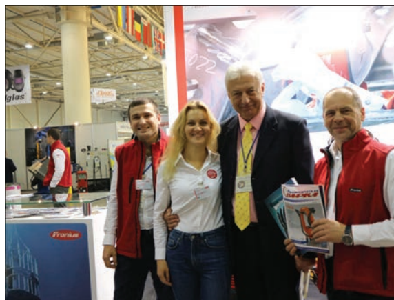
На стенде компании Фрониус Украина

ференция «Современные проблемы сварочного производства», организованная Обществом сварщиков Украины, и конференция, организованная Украинским обществом неразрушающего контроля.