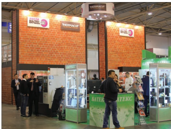
На стенде компании Бинцель Украина